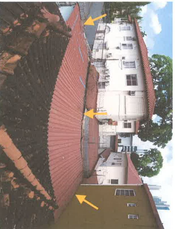
Foto #4 (19-enero-2019): Vista panorámica desde la cumbrera del techo principal hacia la parte posterior del proyecto. Nótese el anexo realizado en 1999 (señalado con flecha naranja). Observamos las alturas de las edificaciones colindantes. Adicional, la condición del techo principal.

Foto #3 (19-enero-2019): Vista desde la cumbrera del techo principal del proyecto hacia la parte posterior del Torreón . Los dueños le brindaron el mantenimiento más reciente hace 20 años.