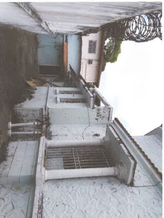
Foto #7 (14-enero-2019): Condición de la fachada lateral izquierda. Se observan elementos discordantes y alteraciones menores que son susceptibles de ser rectificadas.