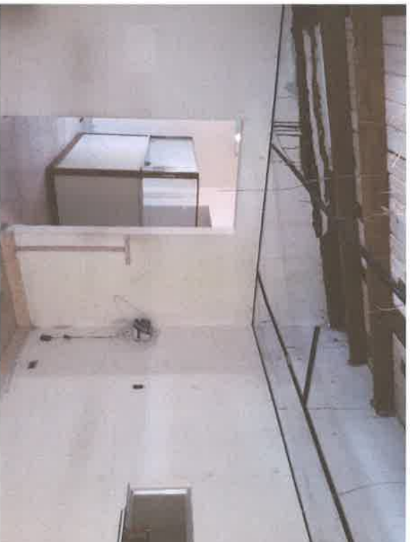
Foto #10 (15-enero-2019): Condición actual interna del inmueble Existente, primigenio. Piso de concreto, paredes de bloques de concreto, techo de madera y tejas imperiales, cielo raso suspendido.