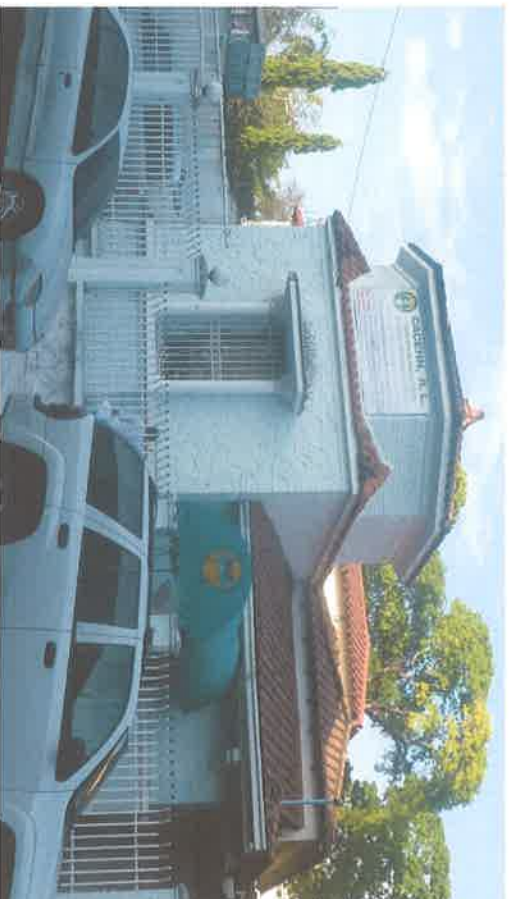
Foto #2 (18-enero-2019): Vista frontal del proyecto, que encaja con la tipología de "Chalet Suburbano", de tipo modesto y sin mayores pretensiones estilísticas. La edificación está compuesta por un basamento, Torreón y volúmenes asimétricos. Nótese la incorporación de elementos adicionales tales como el letrero y la tolda verde con el logo de la Cooperativa. La cerca data de fecha más reciente, pero manteniendo coherencia formal y sin generar confusiones en su lectura.

Foto #1 (20-feb-2019): Ubicación del proyecto. Colinda en los laterales con un lote baldío, utilizado para estacionar vehículos, y con una construcción realizada en el 2016, de planta baja + 2 altos. En la parte posterior colinda con la Embajada de Cuba, que siendo de planta baja + 1 alto, sobresale mucho más debido a las diferencias que existe en la topografía del lugar.