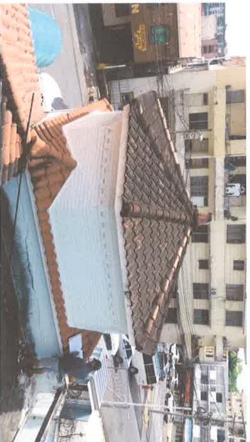
Foto #3 (19-enero-2019): Vista desde la cumbrera del techo principal del proyecto hacia la parte posterior del Torreón . Los dueños le brindaron el mantenimiento más reciente hace 20 años.