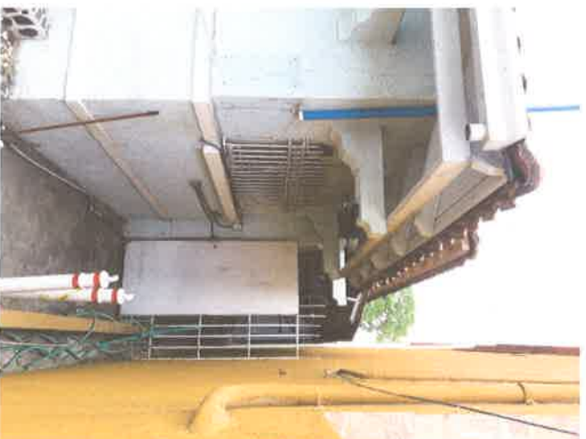
Foto #8 (15-enero-2019): Condición de la fachada lateral derecha. Se observan elementos discordantes y alteraciones menores que son susceptibles de ser rectificadas.