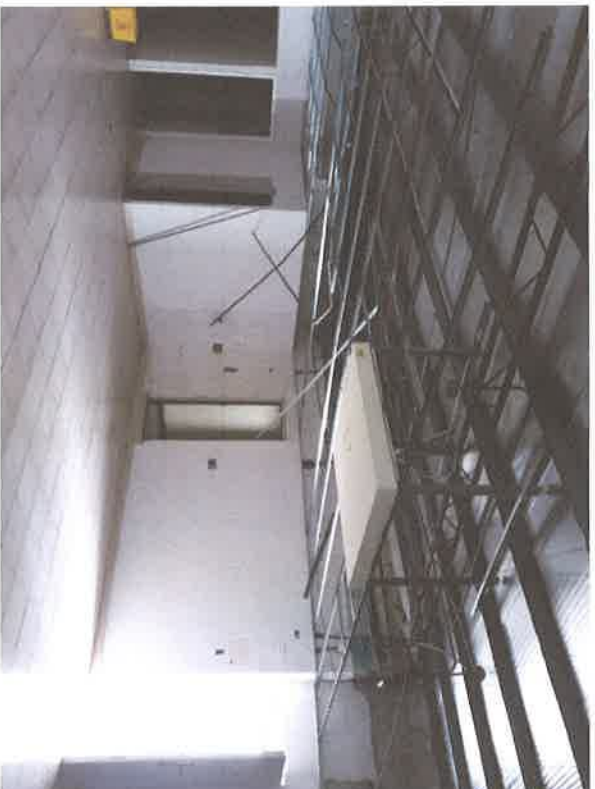
Foto #9 (14-enero-2019): Condición actual interna del anexo posterior discordante que se construyó hacia 1990. Estructura de concreto, techo de láminas zinc, cielo raso suspendido.