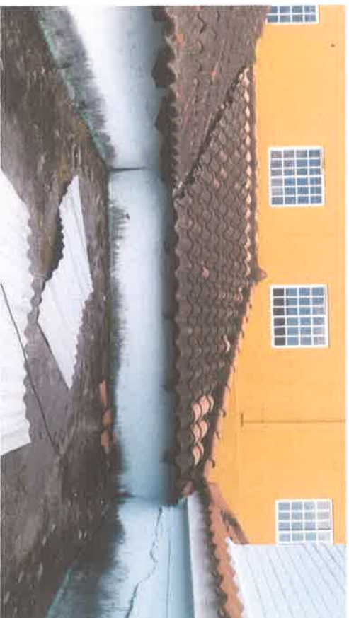
Foto #5 (14-enero-2019): Condición de la losa existente y techo principal de la edificación. En el fondo el vecino colindante derecho, cuyo edificio es muchísimo más alto que el del inmueble objeto de este anteproyecto.