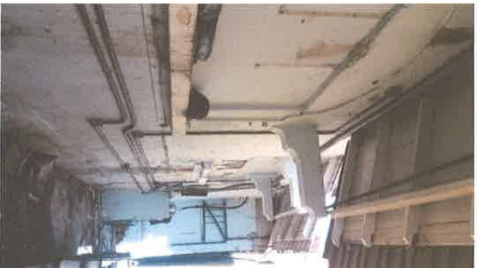
Foto #6 (15-enero-2019): Fachada lateral derecha en donde se muestran tuberías de electricidad expuestas y vanos de ventanas tapados.

Foto #5 (14-enero-2019): Condición de la losa existente y techo principal de la edificación. En el fondo el vecino colindante derecho, cuyo edificio es muchísimo más alto que el del inmueble objeto de este anteproyecto.