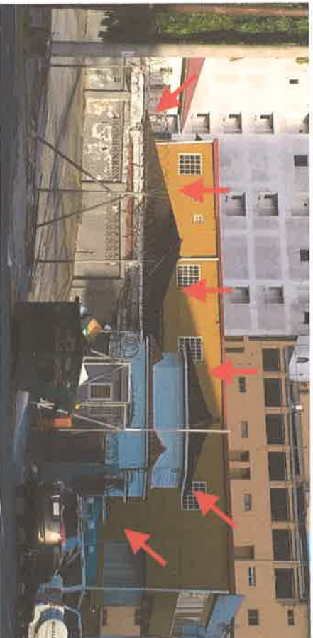
Foto #1 (20-feb-2019): Ubicación del proyecto. Colinda en los laterales con un lote baldío, utilizado para estacionar vehículos, y con una construcción realizada en el 2016, de planta baja + 2 altos. En la parte posterior colinda con la Embajada de Cuba, que siendo de planta baja + 1 alto, sobresale mucho más debido a las diferencias que existe en la topografía del lugar.