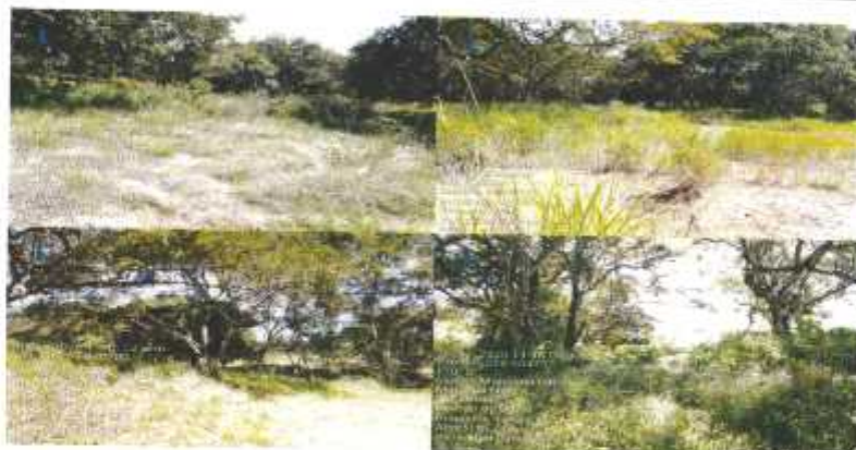
Fig. No. 2: Fotografías tomadas el día de la inspección realizada (16 de diciembre de 2020), de la vegetación observada en el área donde se llevara a cabo el proyecto Residencial Valle del Nance Etapa II