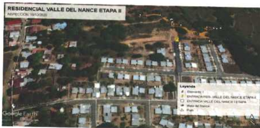
Fig. No. 1: Georreferenciación del área inspeccionada para el desarrollo del proyecto, el día 16 de diciembre de 2020; los puntos blancos corresponden a las coordenadas tomadas en la inspección