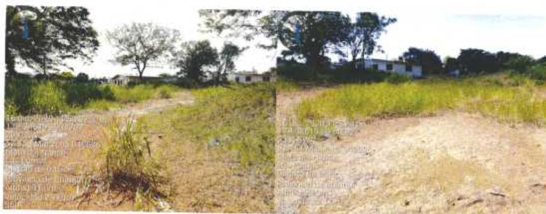
Fig. No. 3: Fotografías de las residencias colindantes al área donde se llevara a cabo el proyecto Residencial Valle del Nance Etapa II, dichas fotografías fueron tomadas el día de la inspección realizada (16 de diciembre de 2020)