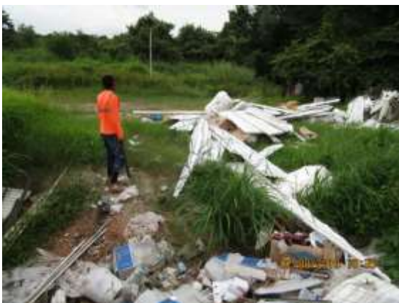
Foto N° 7: Tramo prospectado alterado. Área de almacenamiento temporal de residuos de construcción.