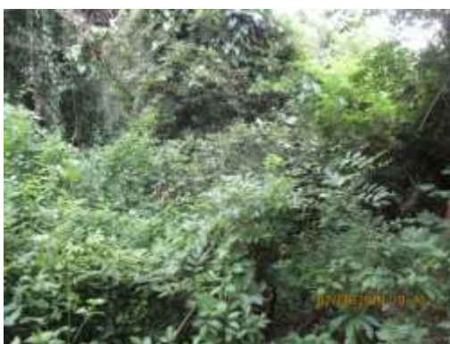
Foto N° 3: Tramo prospectado. Vegetación puntual densa, con el río.