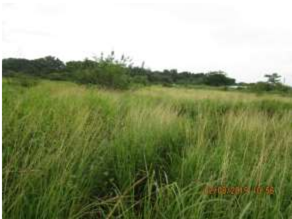
Foto N° 11: tramo prospectado. Terreno plano de potrero. Con gramíneas.