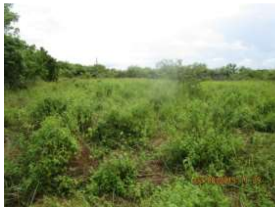
Foto N° 14: tramo prospectado. Terreno plano de potrero. Con gramíneas y maleza.

Durante la prospección arqueológica no se detectaron hallazgos arqueológicos ni a nivel superficial ni sub-superficial. Por lo que se mantuvo la estabilidad del suelo para no afectar la matriz arqueológica. A continuación, se detalla el recorrido con puntos de localización arqueológica dentro del polígono a desarrollar.