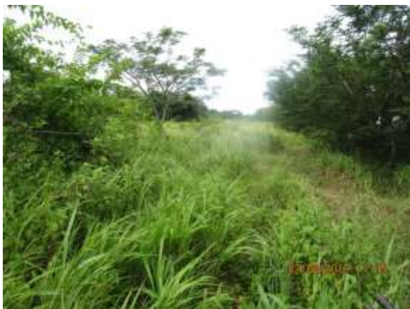
Foto N° 13: Tramo prospectado. Terreno plano de potrero. Con gramíneas.