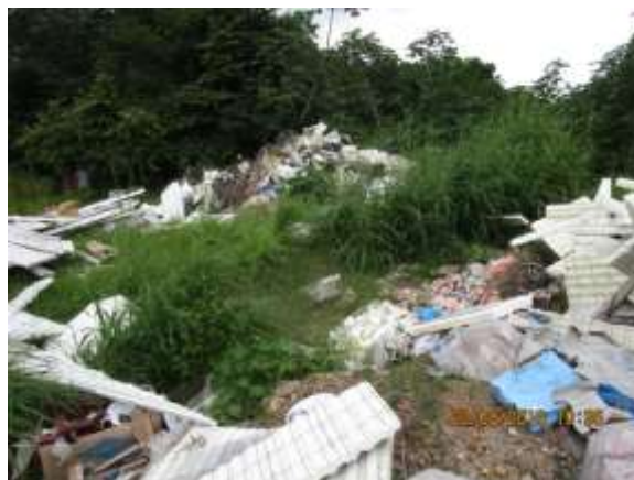
Foto N° 6: Tramo prospectado alterado. Área de almacenamiento temporal de residuos de construcción.