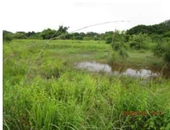
Foto N° 10: Tramo prospectado. Con agua empozada, por las lluvias.