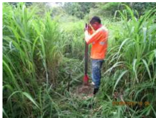
Foto N° 2: Aplicación de sondeo.