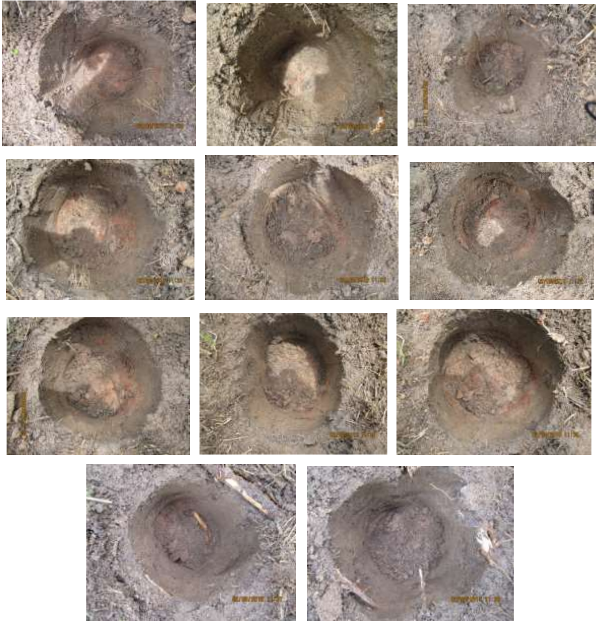
Suelos franco arcilloso-arenoso.