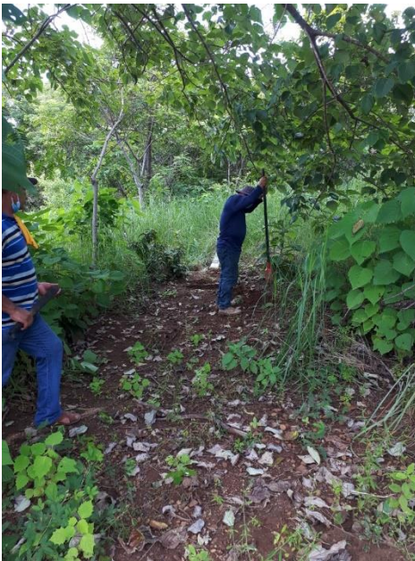
Foto N°3: Prospección Arqueológica- Inicio en el Proyecto Lotificación Hidden Beach