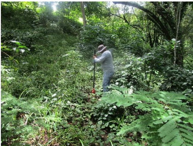
Foto N°6: Prospección Arqueológica- Inicio en el Proyecto Lotificación Hidden Beach