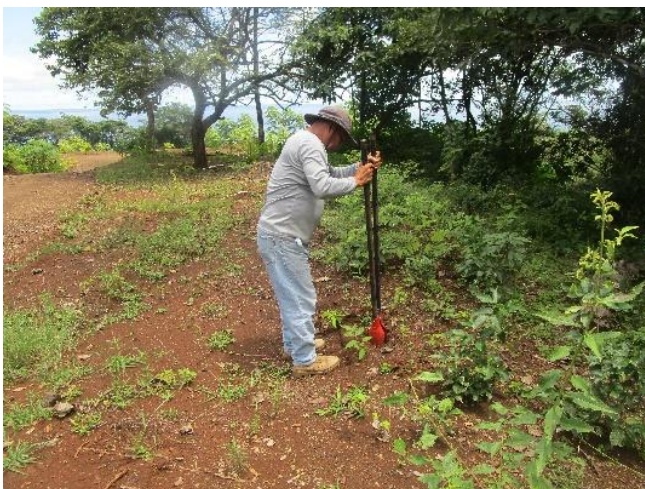
Foto N°4: Prospección Arqueológica- Inicio en el Proyecto Lotificación Hidden Beach