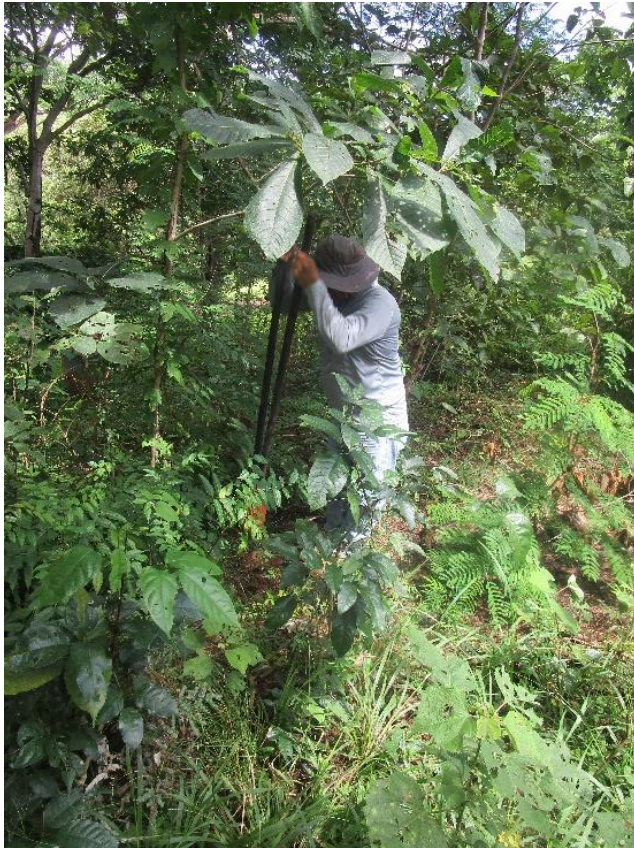
Foto N°5: Prospección Arqueológica- Inicio en el Proyecto Lotificación Hidden Beach