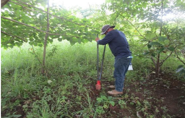
Foto N°2: Prospección Arqueológica- Inicio en el Proyecto Lotificación Hidden Beach