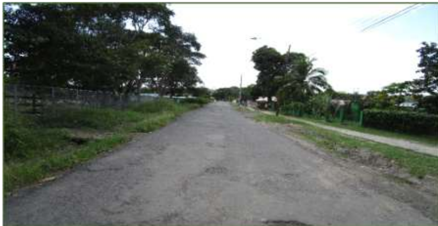
Fotos 5 y 6. Trayecto de caminos que serán rehabilitados.