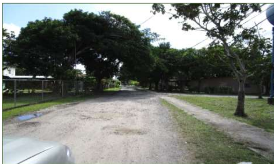
Fotos 7 y 8. Trayecto de camino a rehabilitar y las condiciones actuales de los mismos.