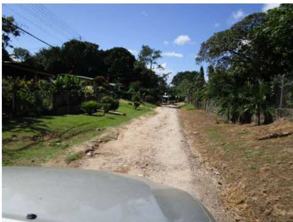
Fotos 9 y 10. Calles de Vista Hermosa, son tramos cortos y calles ya existentes.