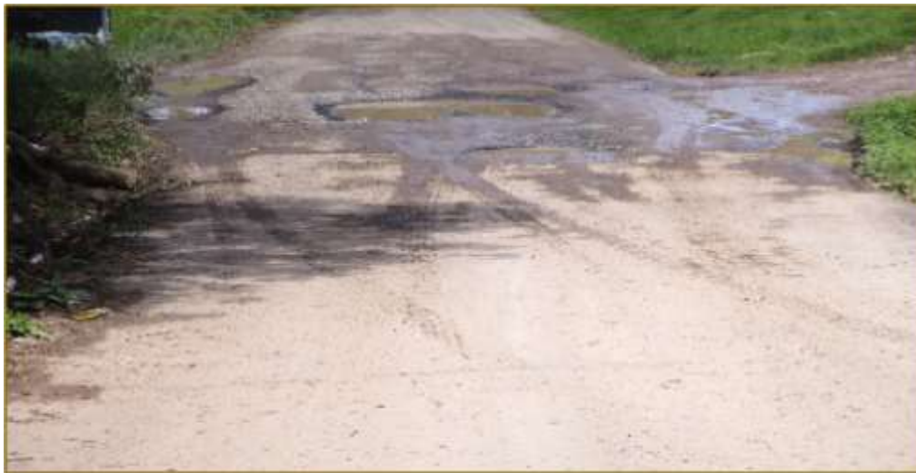
FOTOS 3 Y 4. VISTA DE LA VÍA EN LA CALLE LAS DELICIAS QUE SERÁN REHABILITADAS CON EL PROYECTO.

En la línea de proyecto donde están compactados el piso por rellenos de tosca y gravas, en este caso no aplica los procedimientos de excavación, por su profundidad de relleno, ya que en este tramo no se va a efectuar excavaciones.