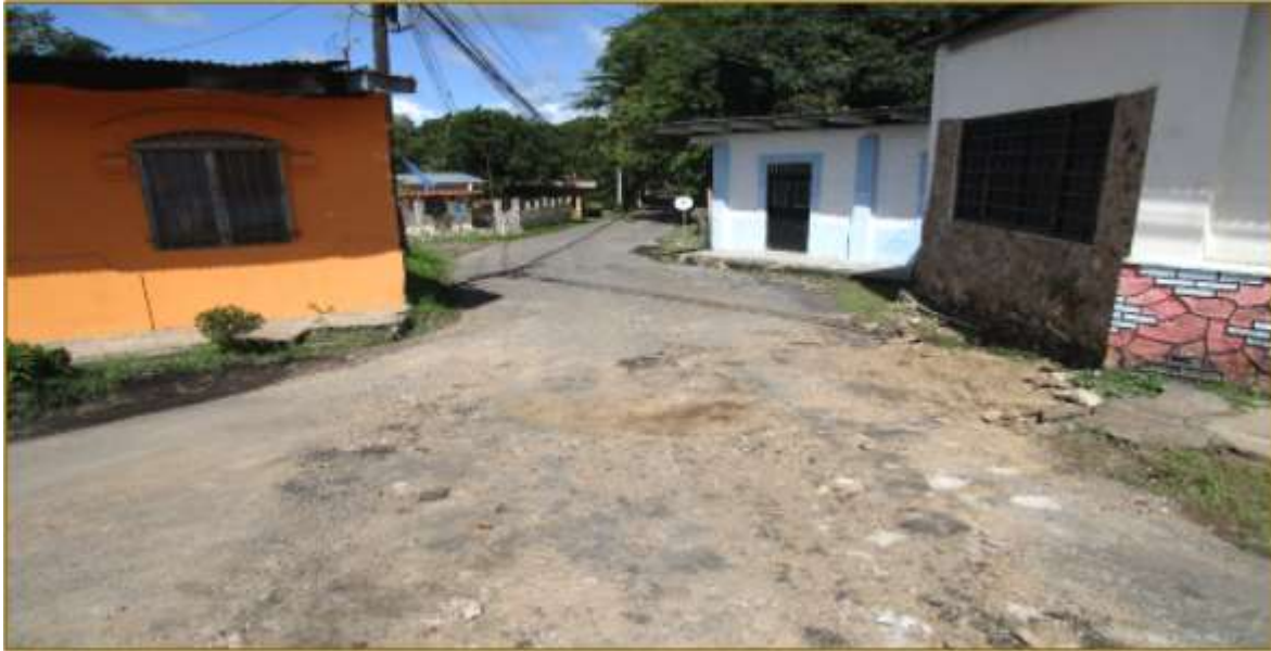
FOTO 2. INICIO DE PROYECTO, CALLE LAS DELICIAS.

La textura observada en el recorrido realizado sobre el área específica representa la composición granulométrica del suelo, siendo que cada termino textural corresponde con una determinada composición cuantitativa de arena, limo y arcilla. La textura más representativa del área de influencia del proyecto es arcillo-acido por las características del suelo de la vegetación existente. (Fuente: EsIA).