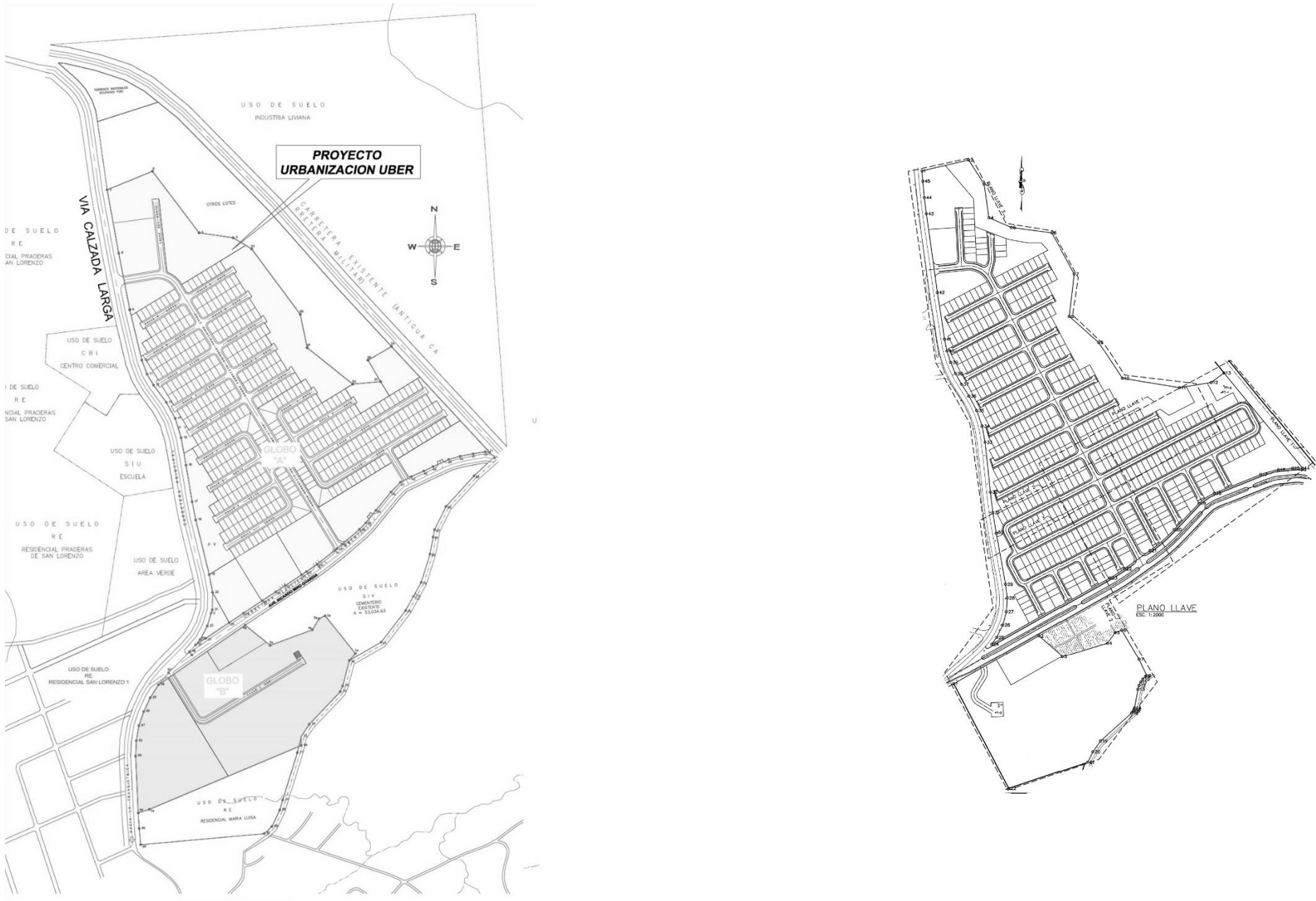
Figura N°1 Lotificación Original vs Lotificación Modificada

A continuación se observa la comparación de los planos del proyecto original y la modificación propuesta: