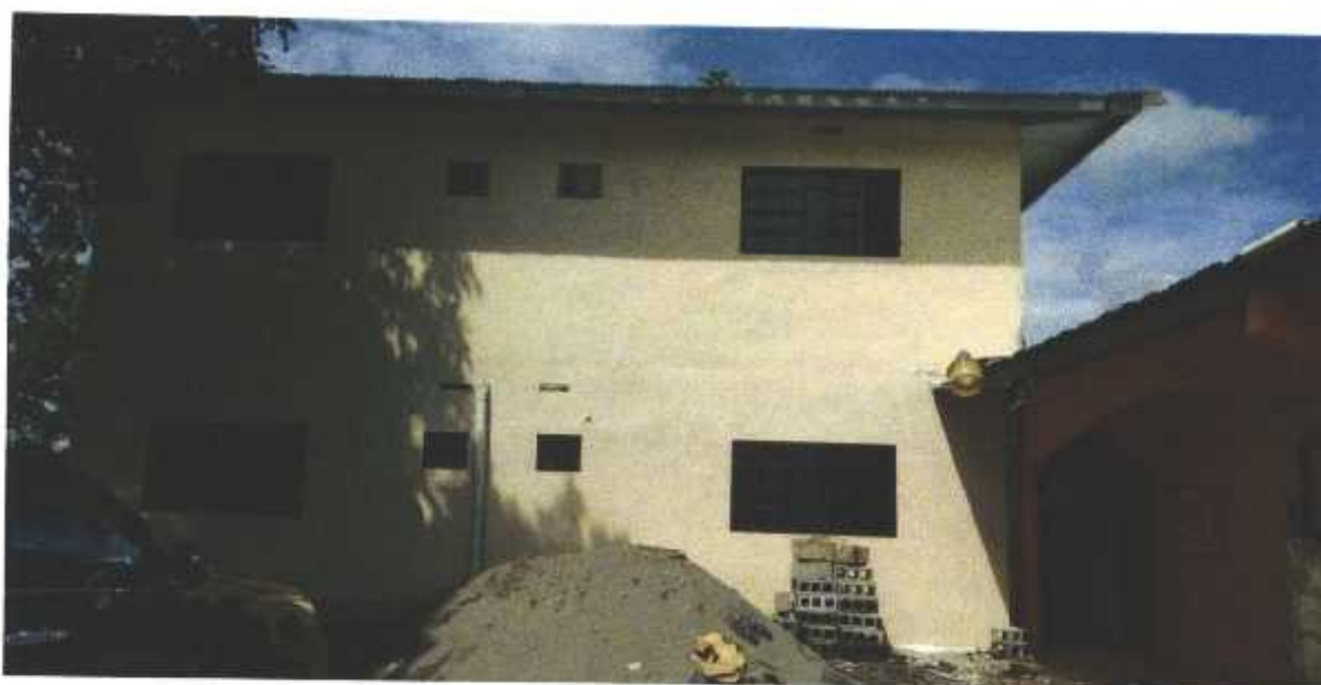
Figura 1. Vista de estructuras ya construidas en el proyecto “OFICINAS-LOCALES”. Corregimiento de San Félix, distrito de San Félix, provincia de Chiriquí, noviembre 2020.