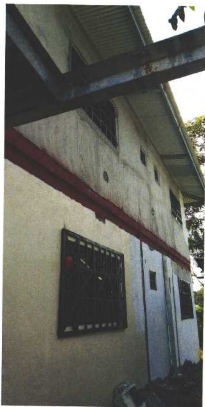
Figura 2. Vista de estructuras ya construidas en el proyecto “OFICINAS-LOCALES”. Corregimiento de San Félix, distrito de San Félix, provincia de Chiriquí, noviembre 2020.