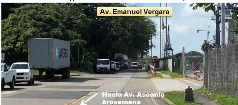
Fotografía 6. Vista de Av. Emanuel Vergara

Esta vía presenta 2 carriles de circulación amplios (1 por sentido), con vehículos estacionados en la mayor parte de la vía. Presenta un pavimento mixto (asfalto y concreto) en mal estado. Las señalizaciones vertical y horizontal se encuentran en estado regular a malo o no existen. Contempla espacio de acera y grama a un lado de la vía. Los bordes de la vía son cordón cuneta.