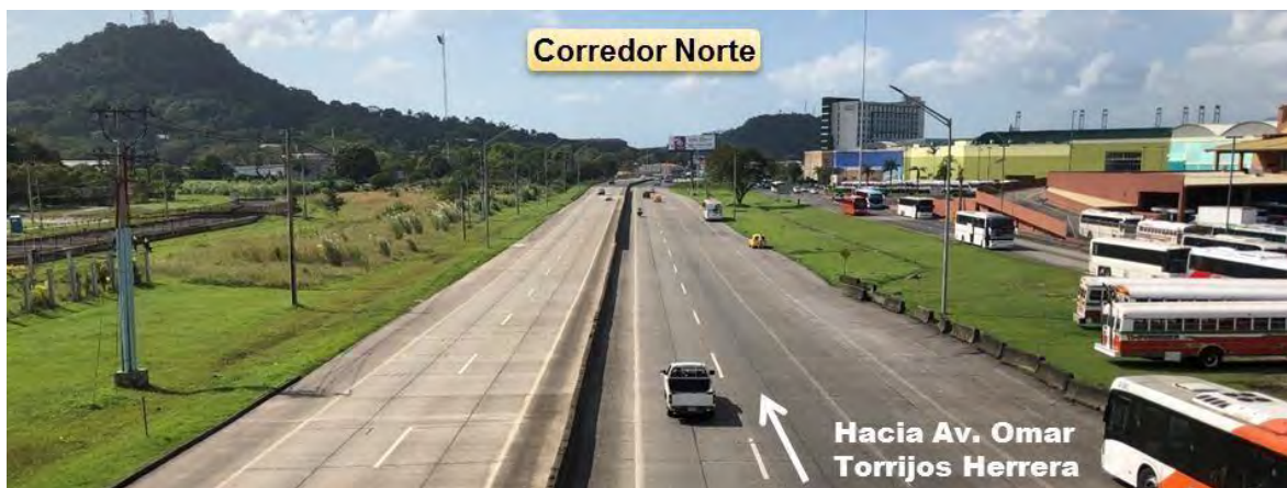
Fotografía 2. Vista de Corredor Norte.

La vía opera con 2 sentidos de circulación y espacio físico de 4 carriles (2 por sentido). La separación de los sentidos de circulación se encuentra dada por barreras de concreto y los bordes son hombros pavimentados. Presenta un pavimento de concreto en buen estado. La señalización horizontal se encuentra en estado regular y la vertical se encuentra escasa en esta sección. La vía no presenta acera ni espacio de grama. Los bordes son hombros pavimentados de concreto.