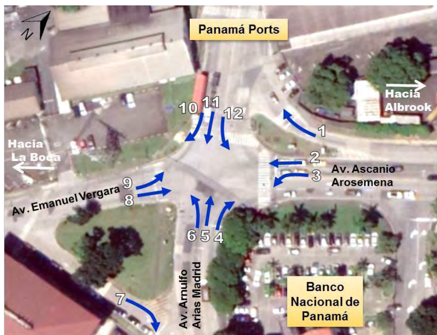
Figura 3. Movimientos Aforados Punto 1.