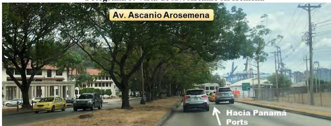
Fotografía 5. Vista de Av. Ascanio Arosemena

encuentra en mal estado y la vertical en estado regular a bueno. Contempla espacio de acera y de grama. La separación de los sentidos de circulación se encuentra dada por isleta central y los bordes presentan cordón cuneta.