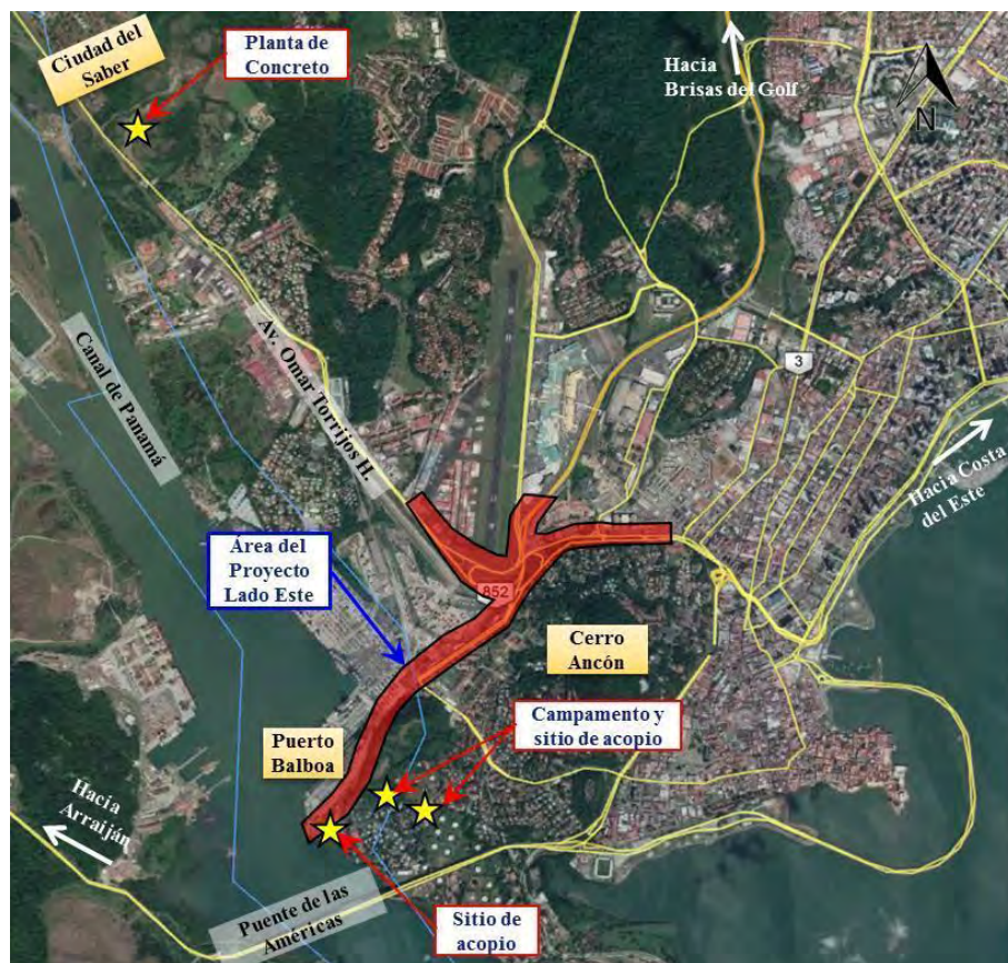
Figura 4. Ubicación de Proveedores Lado Este del proyecto.