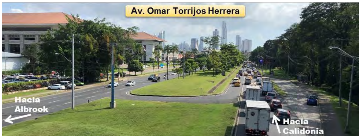
Fotografía 3. Av. Omar Torrijos hacia Tribunal Electoral

aceleración, desaceleración y giro. La vía presenta pavimento de material asfáltico en buen estado. La señalización horizontal es buena y la vertical se encuentra en estado regular a malo. Contempla espacio de acera y de grama en ambos sentidos. Los bordes de la vía son con cordón cuneta, y en ciertos no se observa un borde pavimentado. Los sentidos de circulación se encuentran divididos por una isleta central.