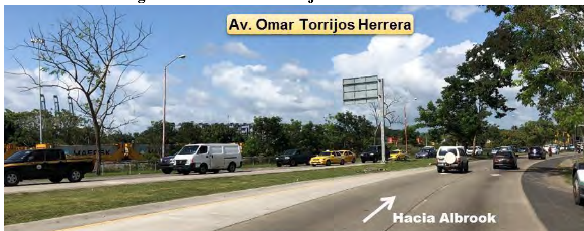
Fotografía 4. Av. Omar Torrijos hacia oficinas del MOP

2: Tramo frente a la plaza Albroom Field: la vía opera con dos sentidos circulación y espacio físico de 4 carriles (2 por sentido). La vía presenta pavimento de concreto en buen estado. La señalización horizontal se encuentra en estado regular y la vertical en buen estado. No contempla espacio de acera. El borde sur de la vía presenta hombro de asfalto, el borde norte sin pavimentar. Los sentidos de circulación se encuentran divididos por una isleta central con grama.