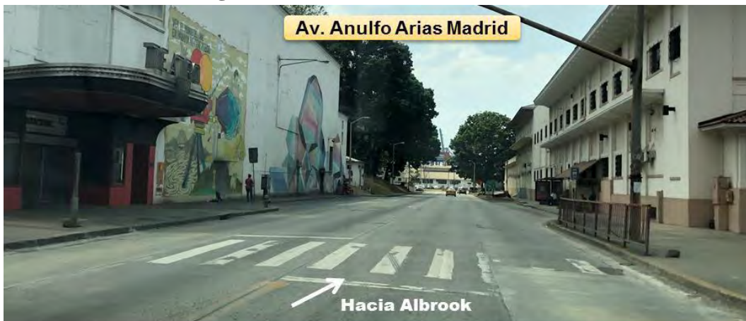
Fotografía 7. Vista de Av. Arnulfo Arias Madrid

estado regular a malo (desgastadas). Contempla espacio de acera en ambos lados de la vía y los bordes presentan cordón cuneta.