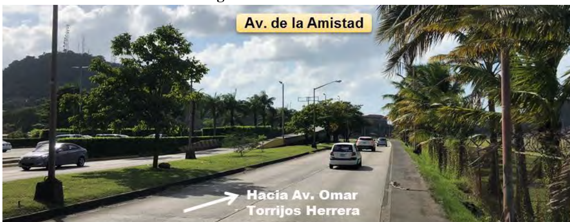
Fotografía 1. Av. de la Amistad.