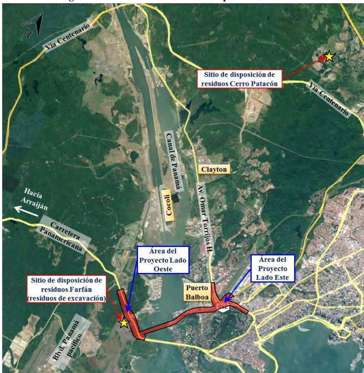
Figura 5. Ubicación de los sitios de disposición de residuos.