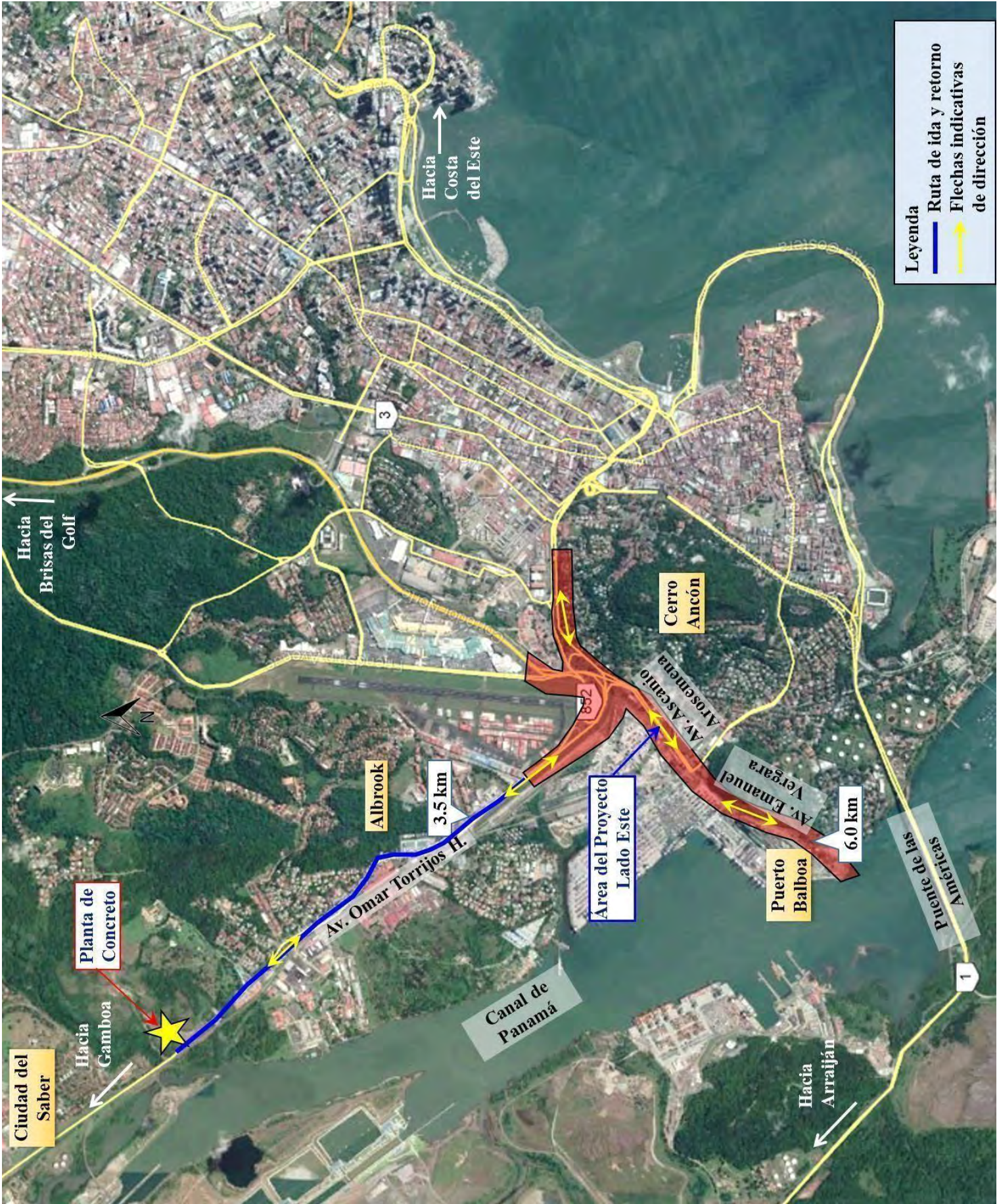
Figura 6. Ruta desde Planta de Concreto Lado Este.