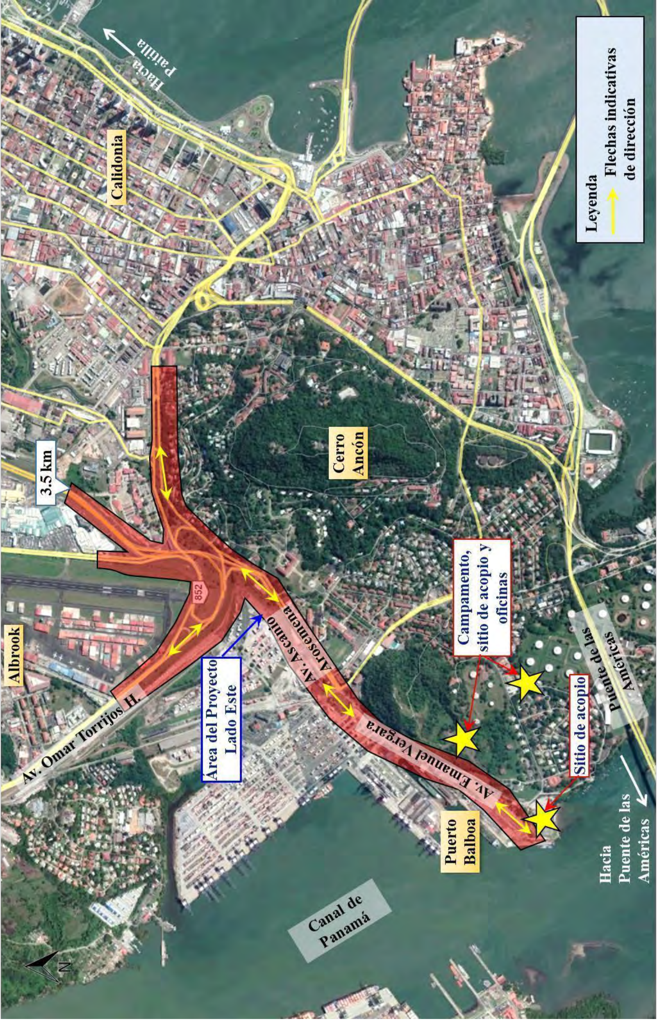
Figura 7. Ruta desde los sitios de acopio y campamento del Lado Este.