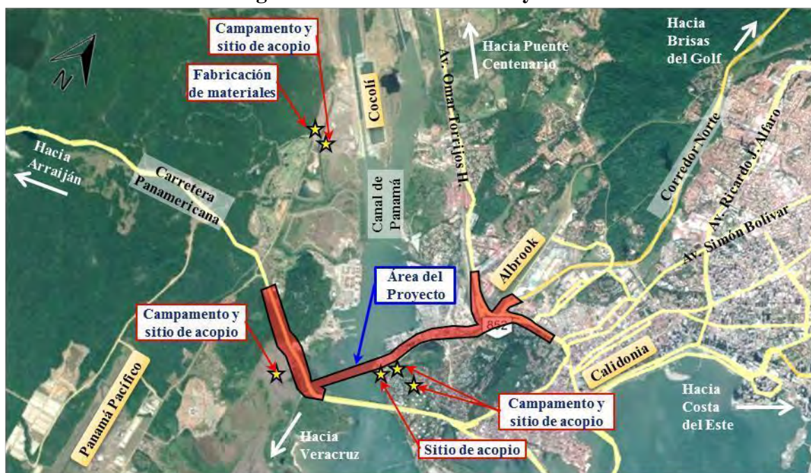
Figura 1. Localización del Proyecto.