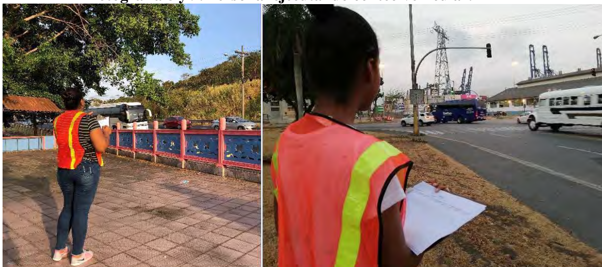
Fotografía 8 y 9. Personal ejecutando conteo vehicular.

Con el objetivo de conocer el tránsito existente que se moviliza por las vías en estudio, se realizaron dos aforos vehiculares tipo intersección el día martes 9 de abril de 2019, el cual se programó parcial de cuatro horas en la mañana (5:00 a 9:00 a.m.) y cuatro horas en la tarde (4:00 a 8:00 p.m.). Las fotografías 8 y 9 muestran al personal realizando el aforo en campo.