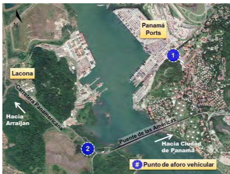
Figura 2. Puntos de Aforo.