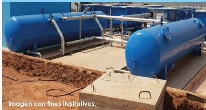
Imagen con fines ilustrativos.

"El proyecto está valorado en B/. 3,910,479.78 (tres millones novecientos diez mil cuatrocientos setenta y nueve balboas con setenta y ocho centavos), y el cual contempla el Estudio, Diseño, Construcción, Operación y Mantenimiento de Obras para la construcción de la Nueva Toma de Agua Cruda y Planta de Tratamiento de Agua Potable para la comunidad de Parita y comunidades aledañas, Distrito de Parita, Provincia de Herrera".