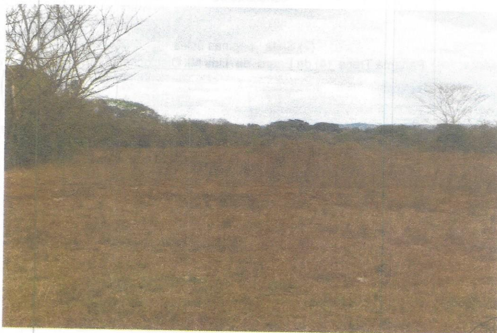
Vista general de la finca 13127, donde se observa su topografía y vegetación existente.