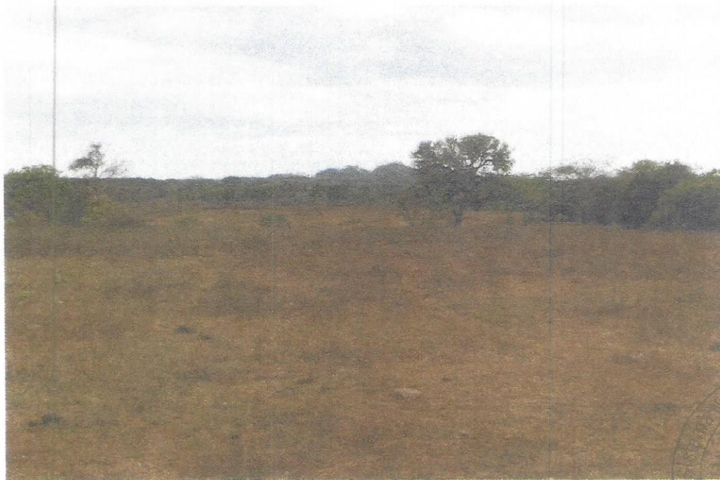
Vista general de la finca 28760, donde se observa la vegetación existente.