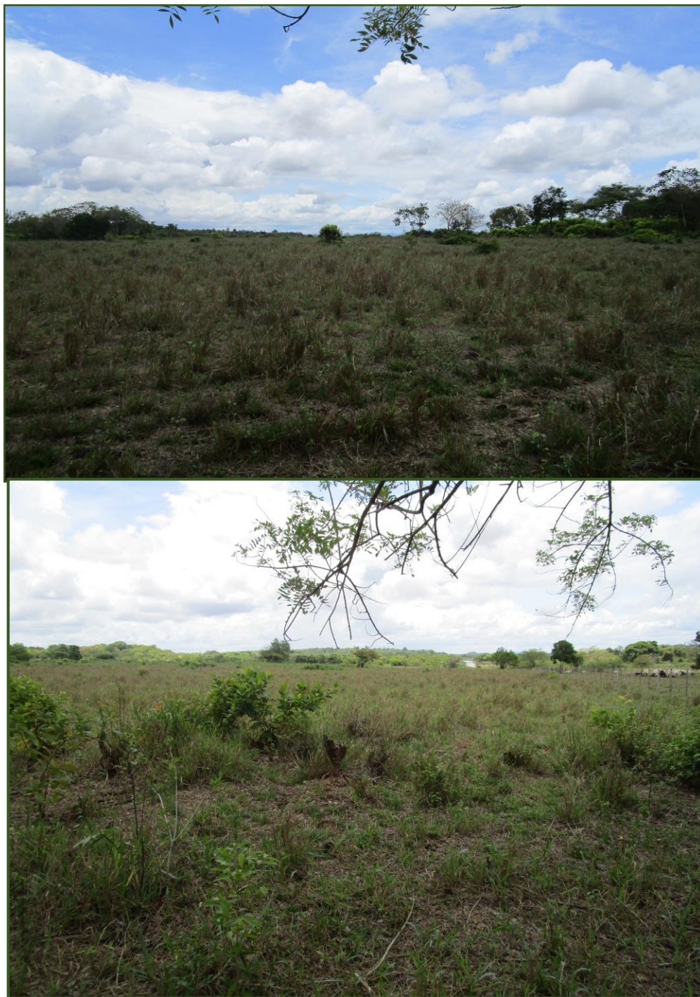
Vista del terreno donde se desarrollará el proyecto.