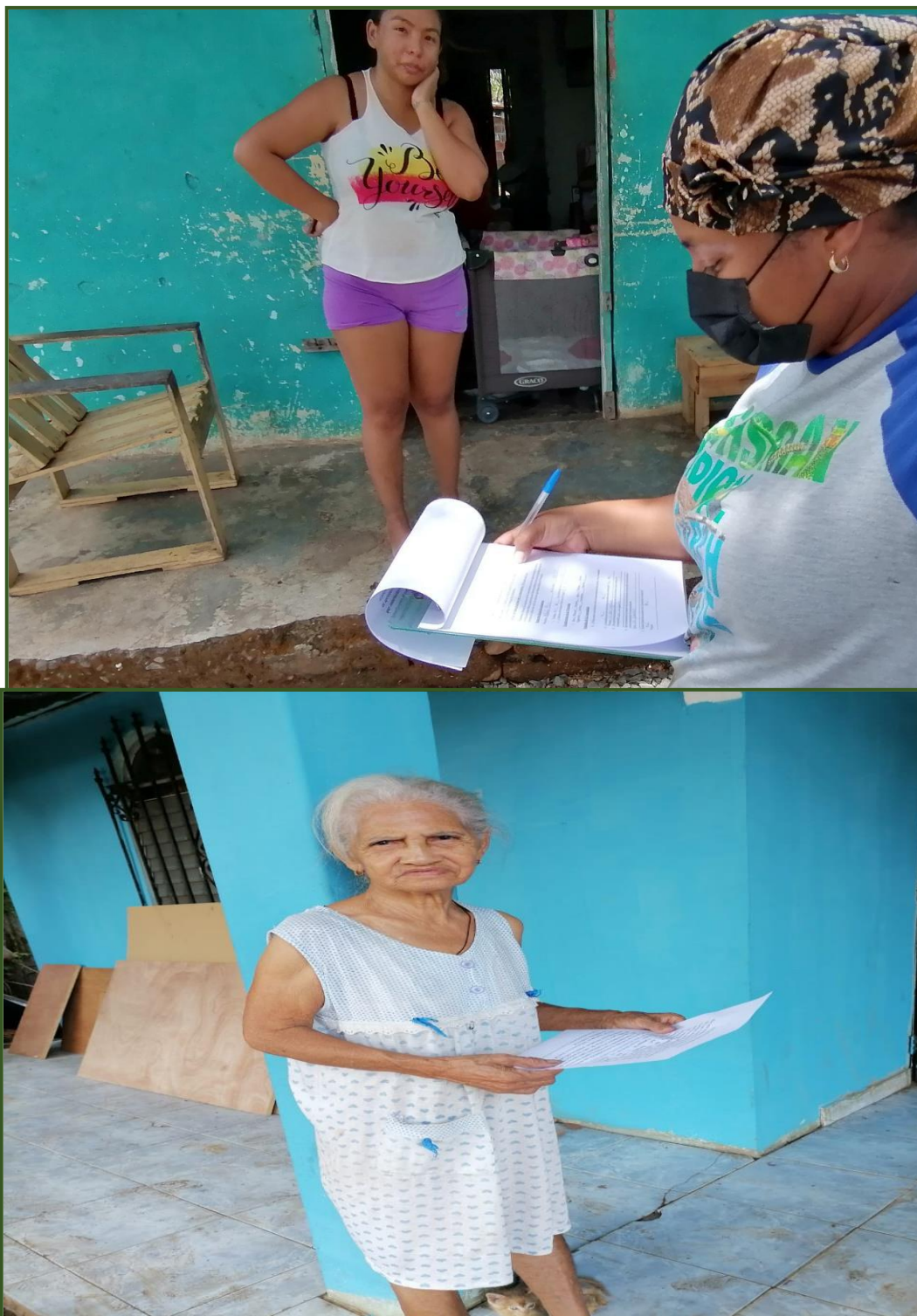
Realización de encuestas y distribución de volantes informativas a la comunidad

ESTUDIO DE IMPACTO AMBIENTAL CATEGORÍA I