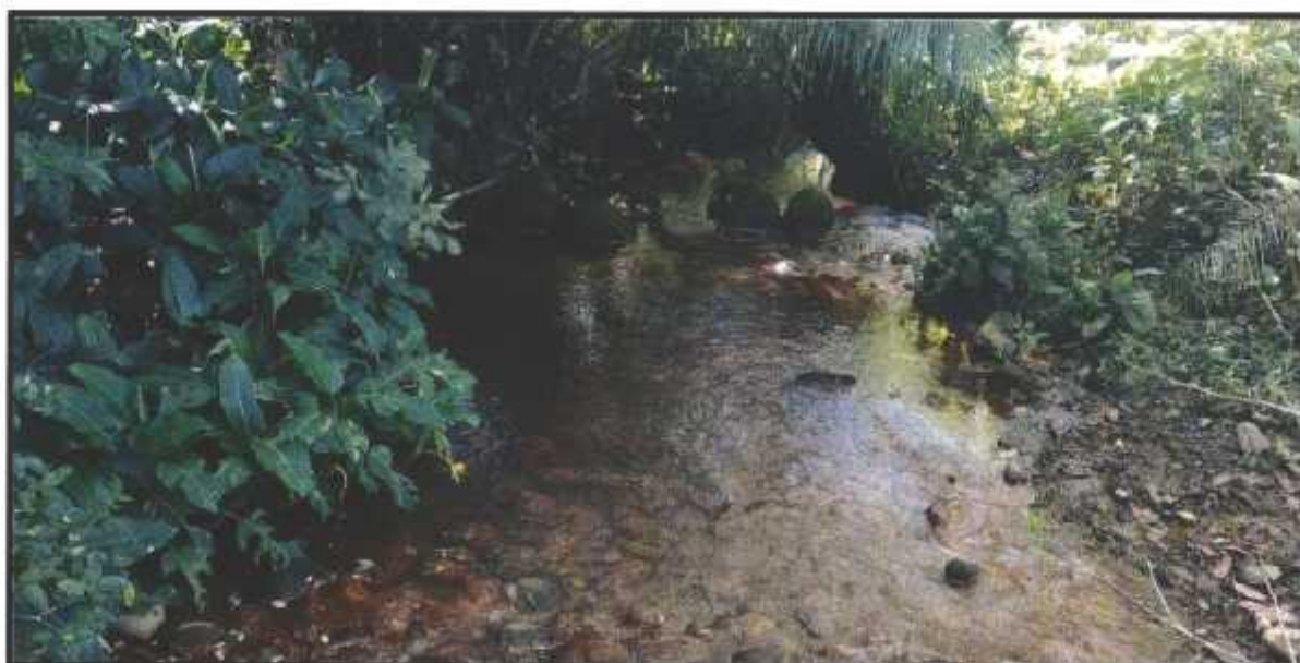
Figuras 6. Vista del cuerpo de agua temporal colindante con el área del proyecto “ URBANIZACIÓN PRADOS DE LA CALZADA ”. Corregimiento de David, distrito de David, provincia de Chiriquí, diciembre 2020.