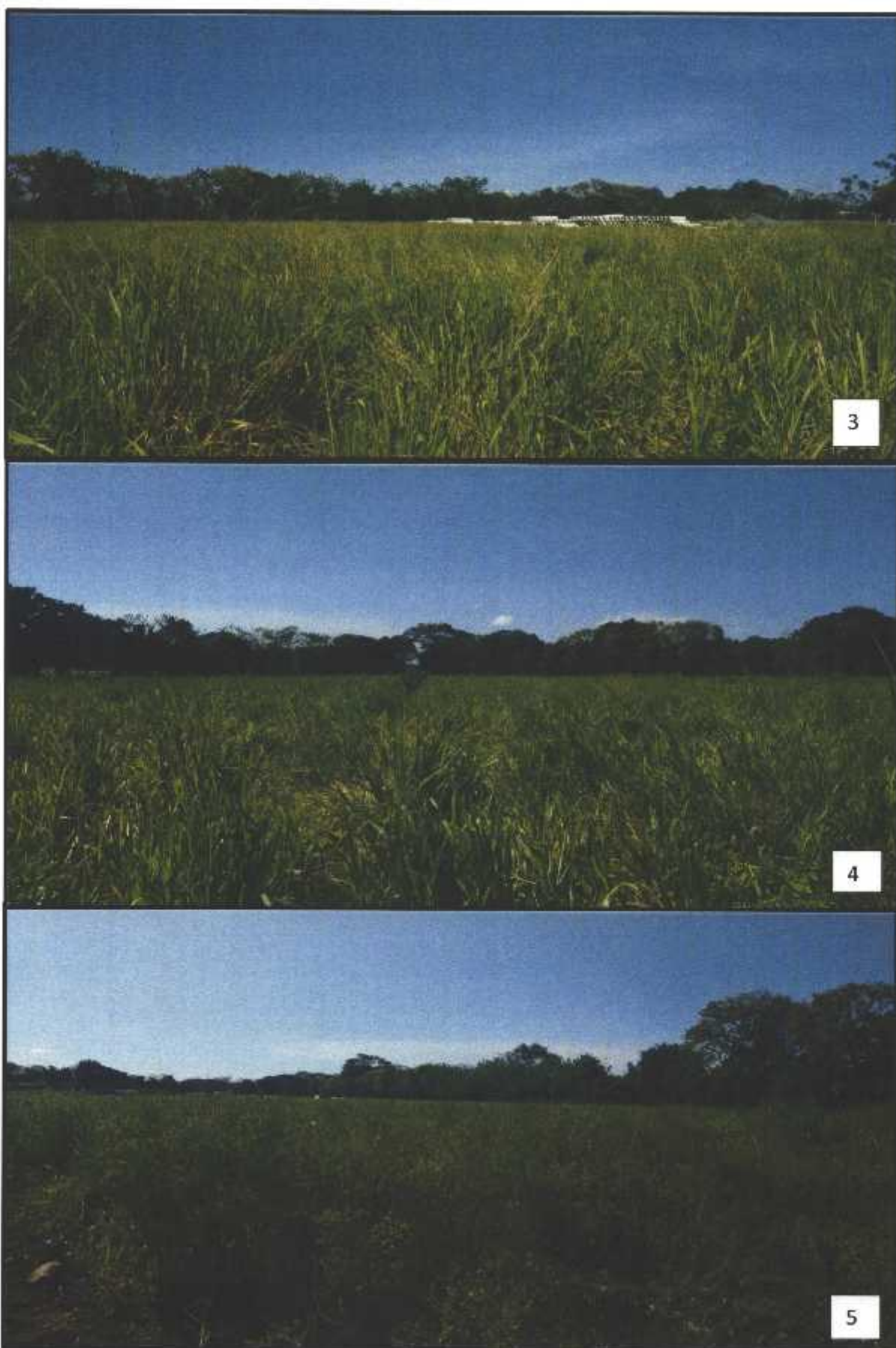
Figuras 3, 4 y 5. Vista del área destinada para la construcción del proyecto "URBANIZACIÓN PRADOS DE LA CALZADA", Corregimiento de David, distrito de David, provincia de Chiriquí, diciembre 2020.