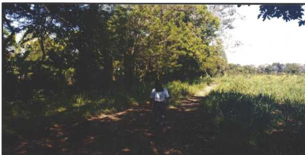
Figura 1. Vista del área destinada para la vía de acceso al proyecto “ URBANIZACIÓN PRADOS DE LA CALZADA ”. Corregimiento de David, distrito de David, provincia de Chiriquí, diciembre 2020.