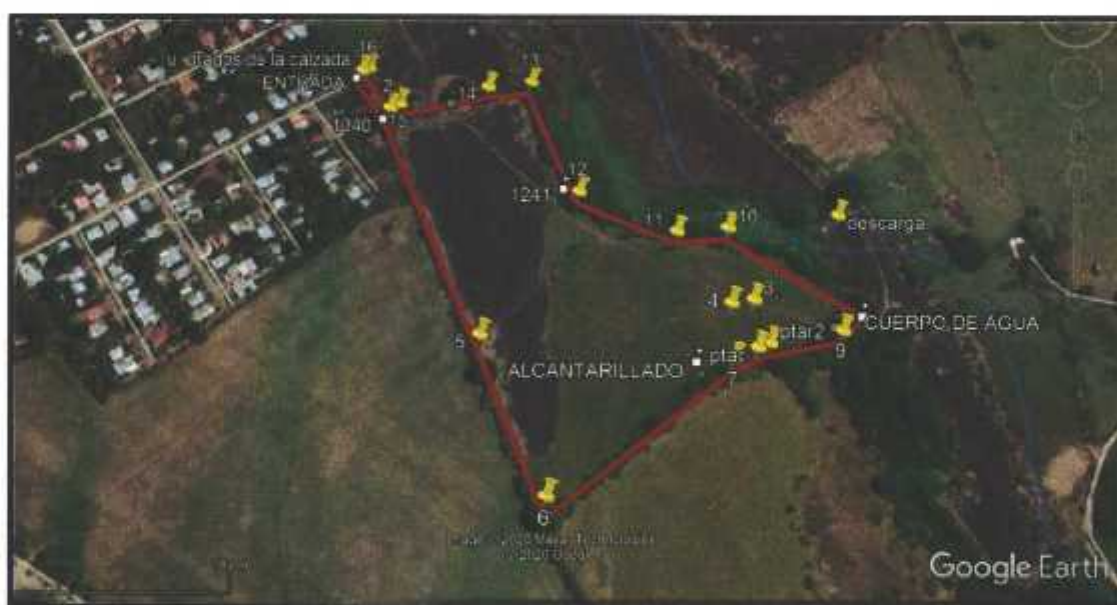
Figuras 7. Vista de Google Earth el área del proyecto “ URBANIZACIÓN PRADOS DE LA CALZADA ”. Corregimiento de David, distrito de David, provincia de Chiriquí, diciembre 2020.