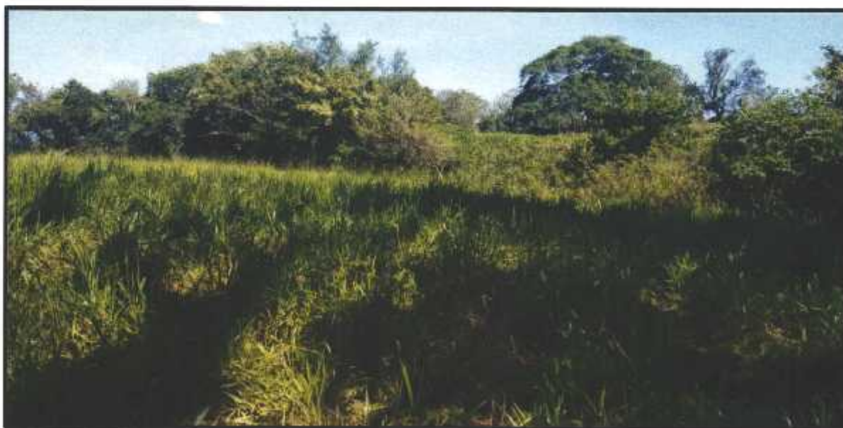
Figura 2. Vista del área destinada para la construcción de la PTAR del proyecto “ URBANIZACIÓN PRADOS DE LA CALZADA ”. Corregimiento de David, distrito de David, provincia de Chiriquí, diciembre 2020.