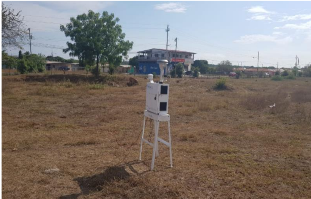
PM1 Terrenos del proyecto residencial Siglo XXI