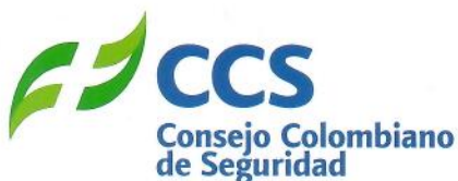
Directora de Certificación Certification Director CCS

Fecha última modificación: Last modification date