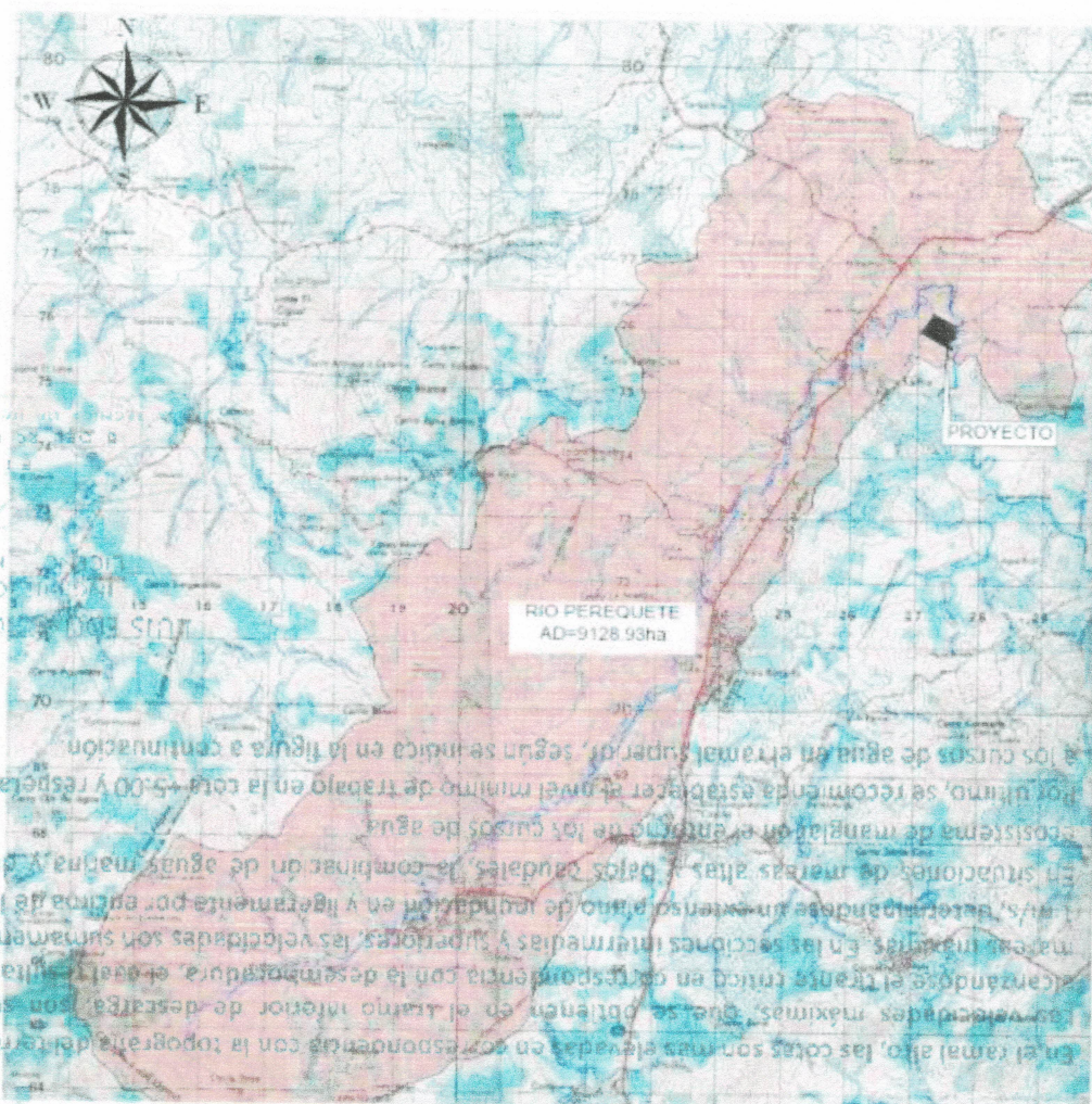
Figura 3. Área de drenaje

La cuenca total en estudio del Río Perequete en el punto de interés, barre una superficie, aproximada de 9128.93ha. De acuerdo con las normas del Ministerio de Obras Públicas, entidad reguladora sobre las Quebradas y Ríos, cuando el área de drenaje supere las 250 hectáreas, el cálculo del caudal debe realizarse mediante el Lavalin, por lo que el análisis para el calculo del caudal del Río Perequete se utilizara el Método de Lavalin.