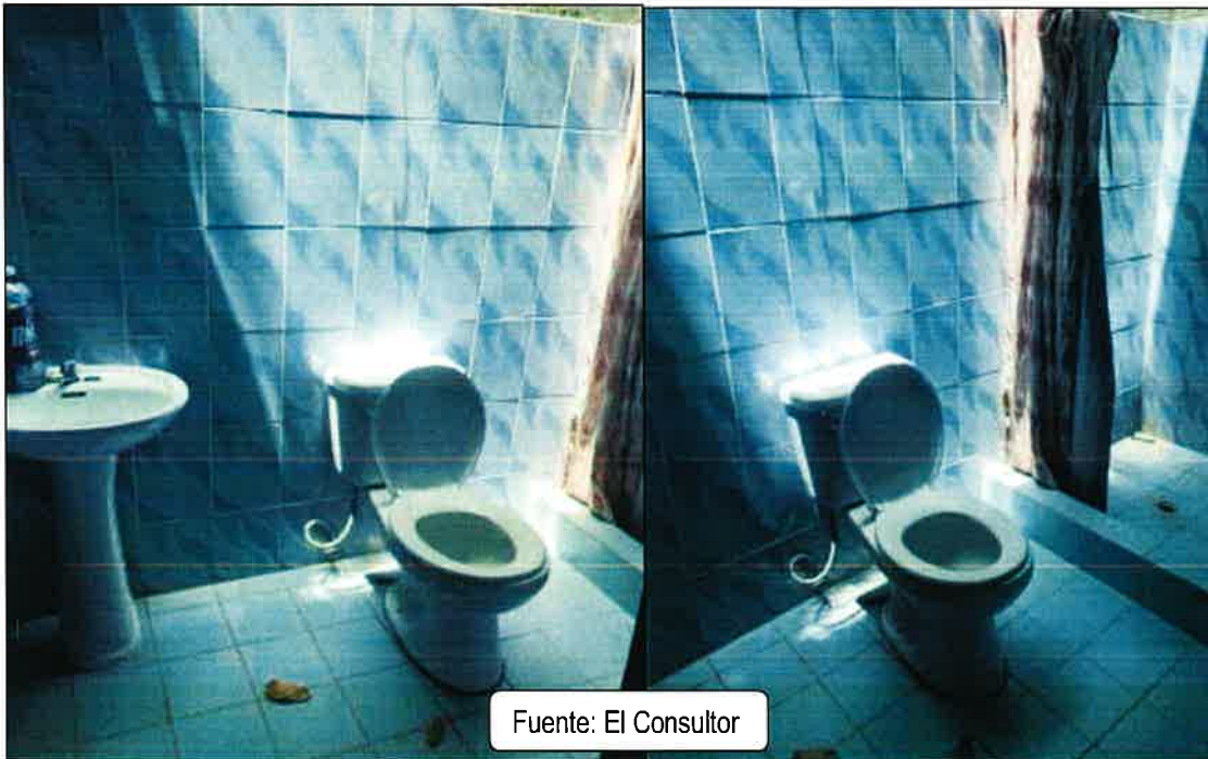
Foto No.3 Aquí se observa la entrada al baño existente.