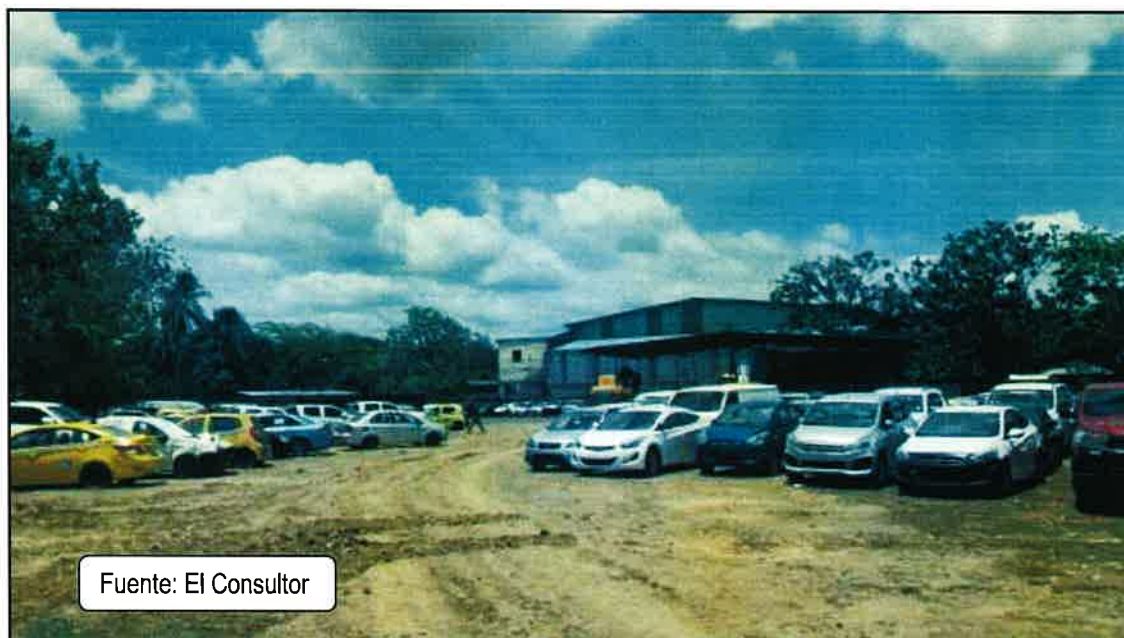
Foto No.1 Vista del proyecto aprobado en el año 2013 a través de la Resolución ARAPM-APA-083-2013 y que forma parte del mismo Promotor para lo cual los trabajadores utilizaran el baño higiénico existente, durante las actividades del nuevo estudio en aprobación.