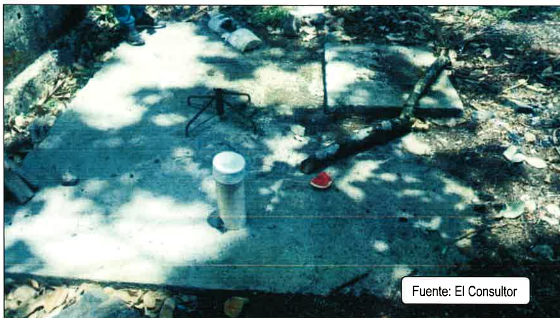
Foto No.2 Vista del tanque séptico existente aprobado por el Ministerio de Ambiente a través de la Resolución ARAPM-APA-083-2013 y que forma parte del mismo Promotor y a donde irán las aguas residuales productos de los trabajadores del proyecto en ejecución.