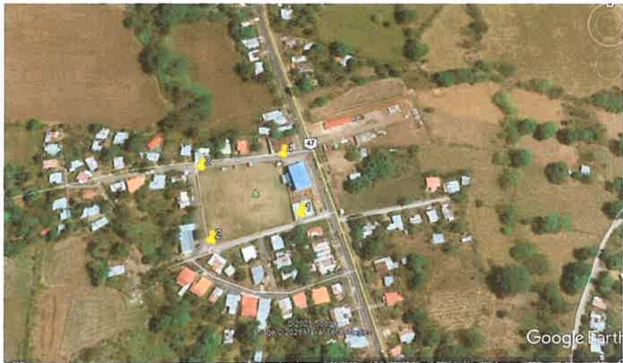
Figura 1. Ubicación Geográfica del Proyecto “ESTUDIO, DISEÑO Y CONSTRUCCIÓN DEL ESTADIO DE PEQUEÑAS LIGAS EN TIJERA, DISTRITO DE BOQUERÓN. PROVINCIA DE CHIRIQUÍ.