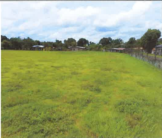
Foto. 2. Se observa la superficie donde será el área verde del Estadio a construir.