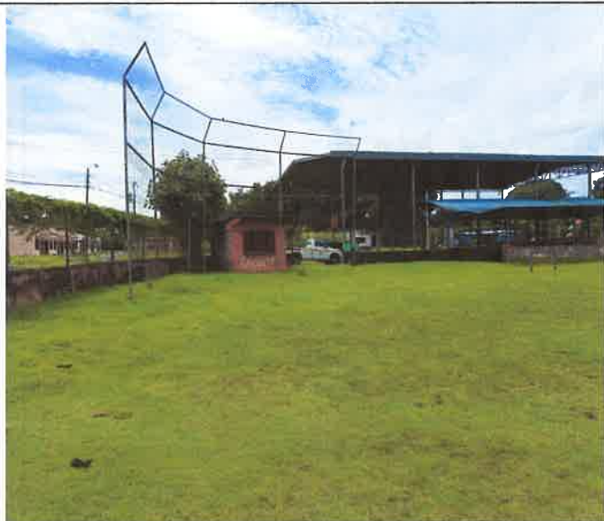
Foto. 1. En la vista se observa el frente donde será la entrada al Estadio y algunas de las casetas que serán demolidas.