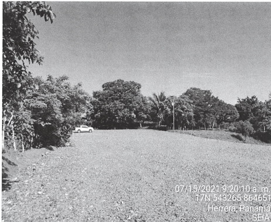
Fig. N° 2 Otra vista del polígono donde se pretende construir la galera.