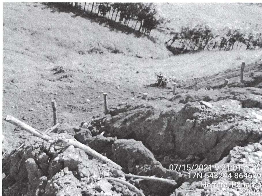
Fig N° 3 Se observa deslizamiento de tierra en la parte norte de la finca, si que se haya aplicado medidas de mitigación para evitar afectaciones al terreno colindante.