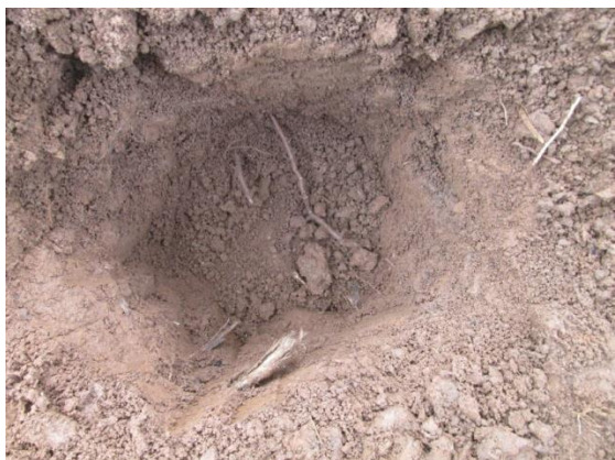
Foto No. 17 Sondeo No. 9