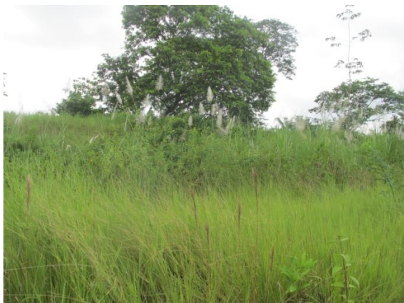
Foto No. 8 Prospección en polígono