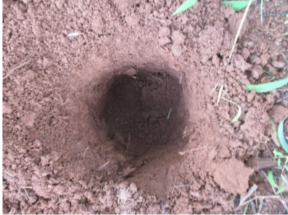
Foto No. 3 Sondeo No. 1