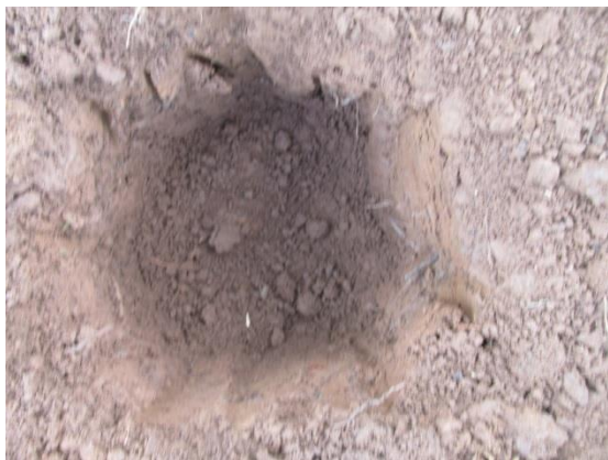
Foto No. 5 Sondeo No. 3