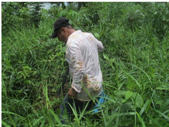
Foto No. 11 Se tuvo que realizar trochas en Algunos tramos durante el recorrido