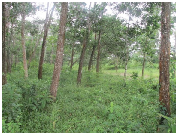
Foto No. 7 Prospección en polígono