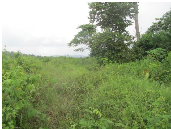
Foto No. 1 Prospección en polígono