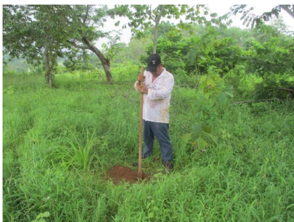
Foto No. 2 Aplicación de sondeos en polígono