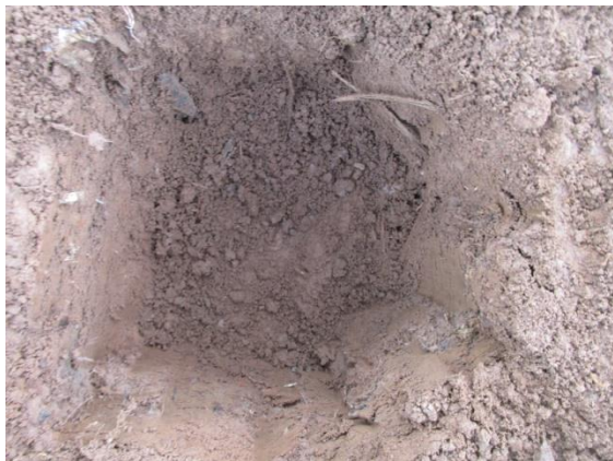
Foto No. 6 Sondeo No. 4