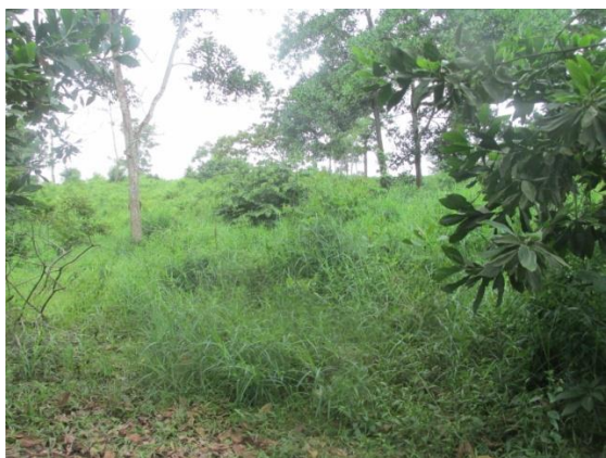
Foto No. 18 Área prospectada