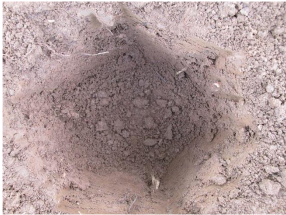
Foto No. 4 Sondeo No. 2