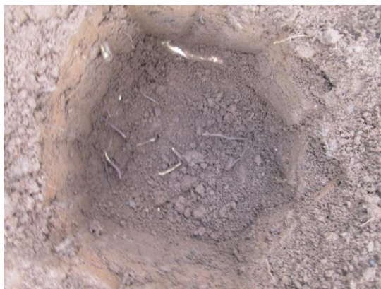
Foto No.13 Sondeo No. 5