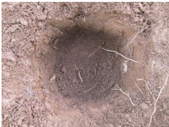
Foto No. 15 Sondeo No. 7

A continuación el siguiente cuadro de las coordenadas tomadas durante la prospección arqueológica en el polígono: