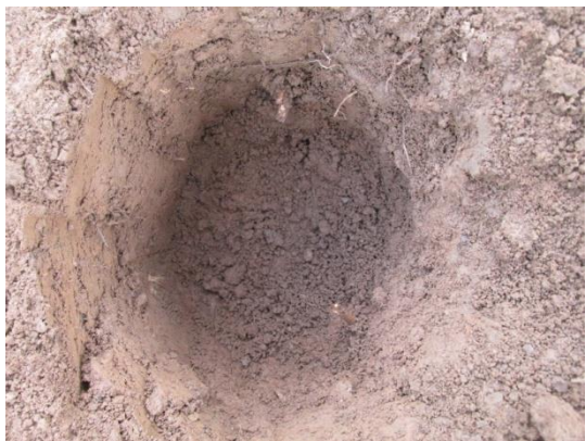
Foto No. 14 Sondeo No. 6