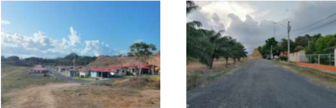
Figura N°6.2. Áreas alrededores del proyecto.