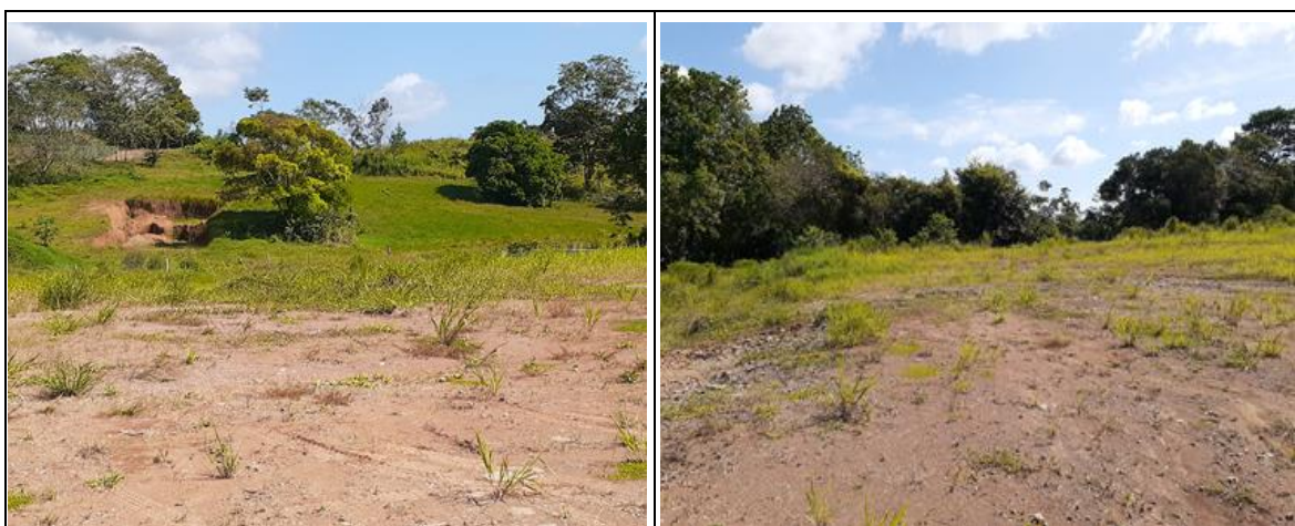
Figura 3. Vista panorámica del área de influencia directa del proyecto

El paisaje nos muestra un área rural agropecuaria, que se combinan con proyectos barriales y comercios diversos, todo en una topografía con áreas mixtas. El sitio no presenta quebradas ni drenajes naturales, que atraviese el terreno, tampoco observamos presencia de fauna (aves, mamíferos o anfibios) en el área de influencia directa del proyecto. No existe fuente de ruido ni de emisiones de gases y partículas, pero se puede generar e incrementar temporalmente al momento del desarrollo de las actividades de construcción.