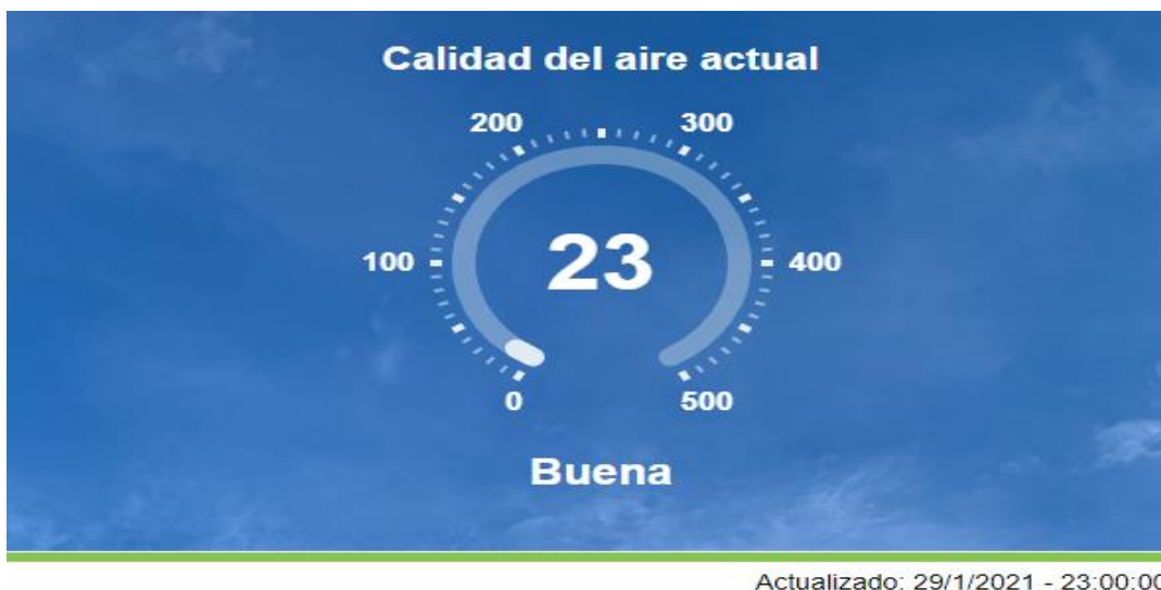
Figura 2. Calidad de aire