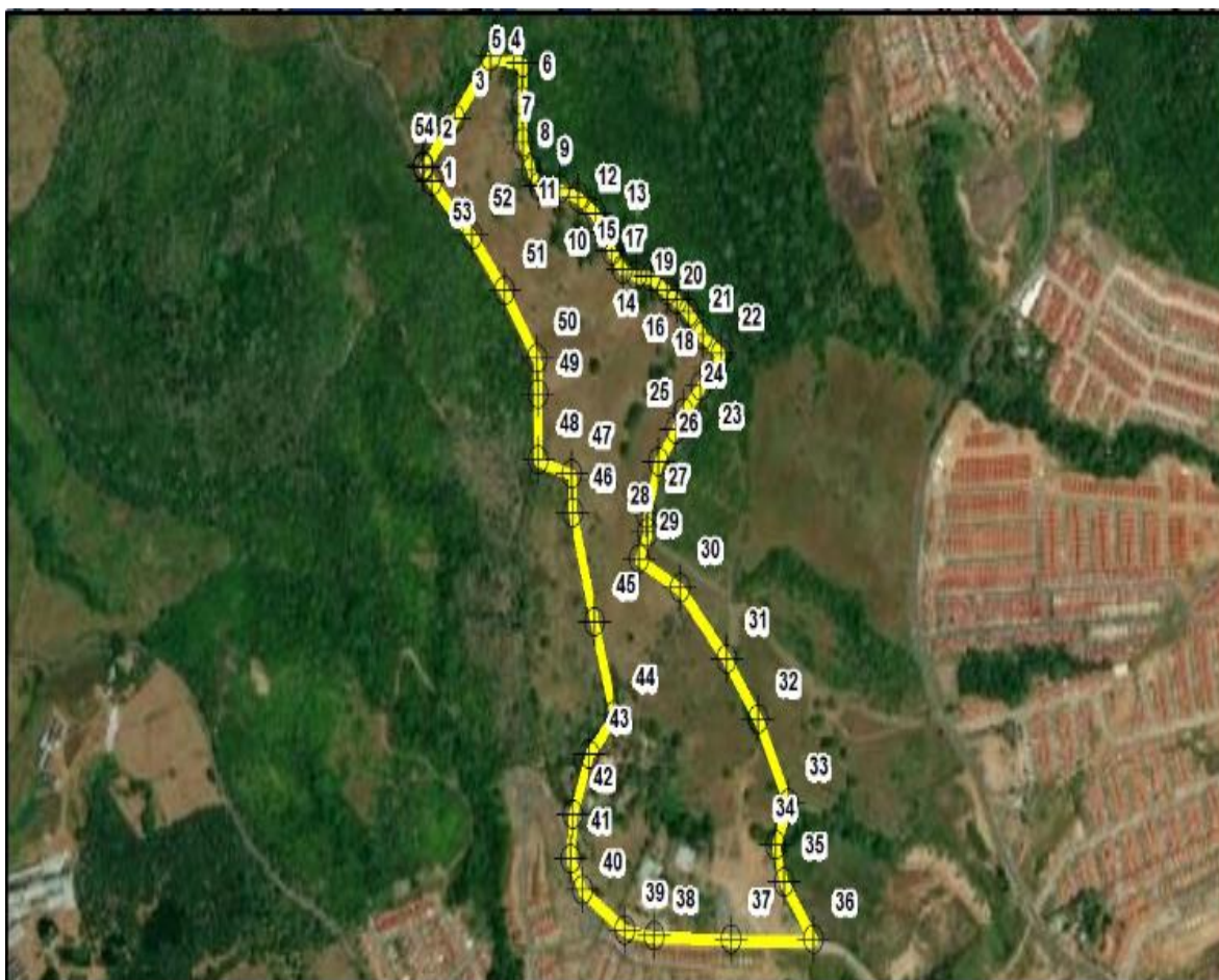
Imagen 1. Ubicación del proyecto