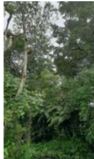
Imagen: vegetación aguas arriba. Directamente influenciada.

Inventario forestal se registraron 7 árboles que posiblemente sean afectados por los trabajos de colocación del nuevo puente, estos árboles tienen un volumen de madera de 0.5529 m 3 a continuación presentamos el listado de los mismos.