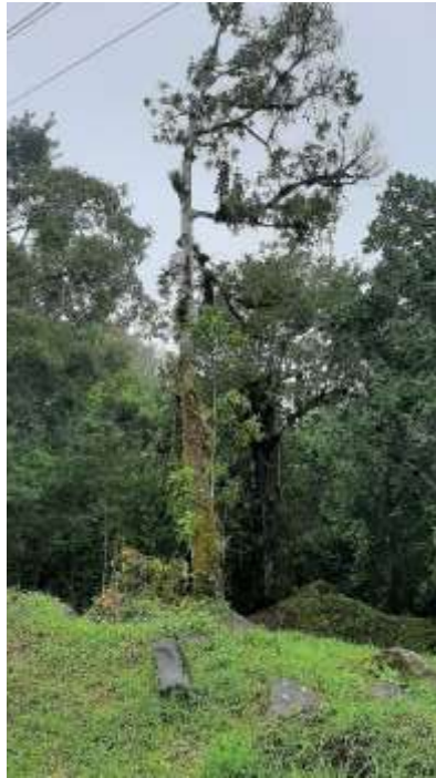
Imagen: Zona del puente aguas abajo y la vegetación influenciada directamente por el proyecto.

Con respecto a la vegetación aguas arriba podemos observar una vegetación igual de rastrojo con las mismas especies, pero un poco más densa y enmarañada, donde además de la vegetación nativa podemos reportar la presencia de algunas especies cultivadas como Pito ( Erythrina sp ) y guayaba ( Psidium guajava ). Se registraron también 4 árboles, uno guabita de río ( Inga sp. ), un higo ( Ficus sp. ) y dos de ( Miconia sp. )