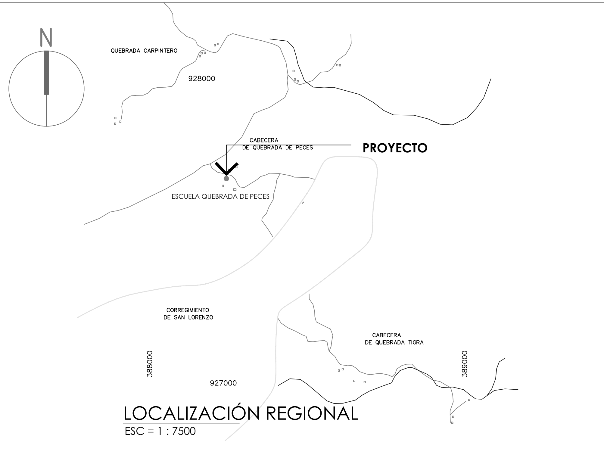
LOCALIZACIÓN REGIONAL ESC = 1 : 7500