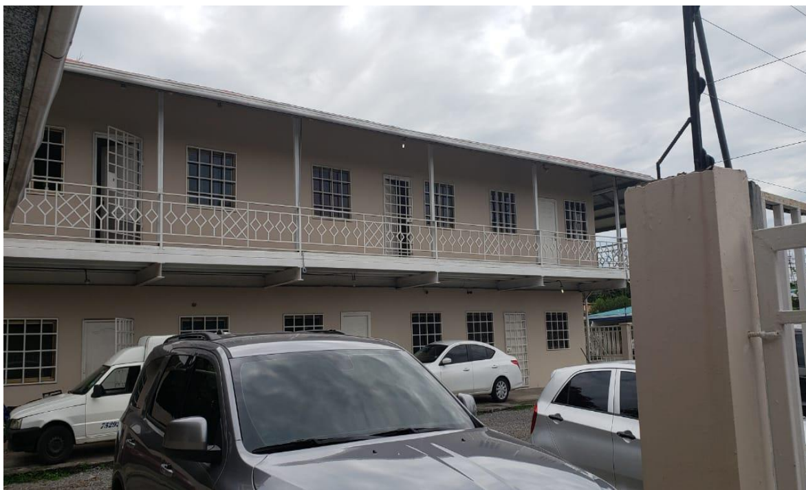
Vista del edificio de 6 apartamentos que tiene el Estudio de Impacto Ambiental IA-474-2008 del 17 de julio de 2008.