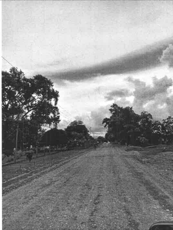
Fig. No.5 Calle principal en Finca 6.