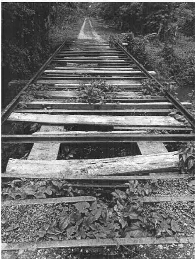
Fig. No.1: Estructura de hierro de antiguos puentes, vista de uno de cinco puentes, que requiere construcción de nuevos puentes.