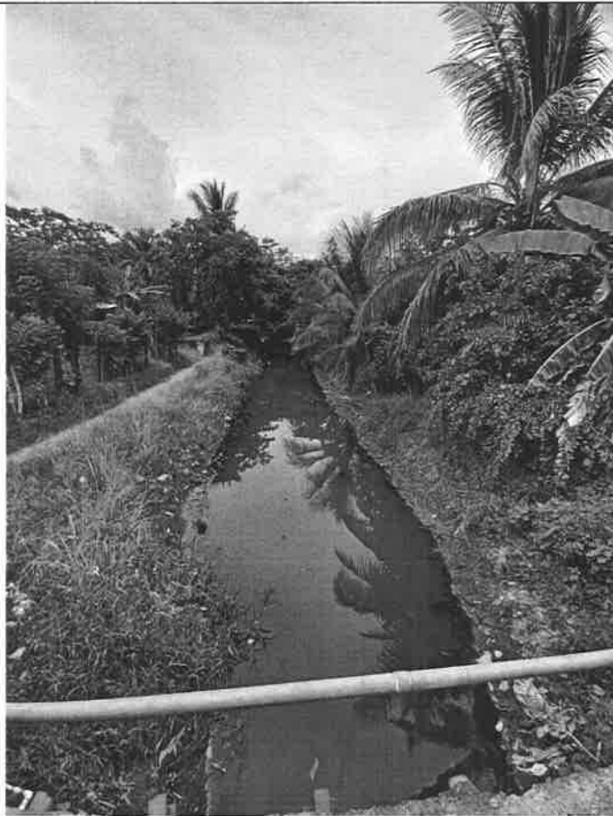
Fig. No.4 Puente sobre canal en Barriada 4 de Abril.