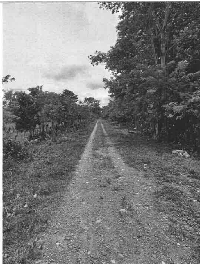
Fig. No.2: Vista de la antigua vía férrea desde Guabito hacia Milla 21.