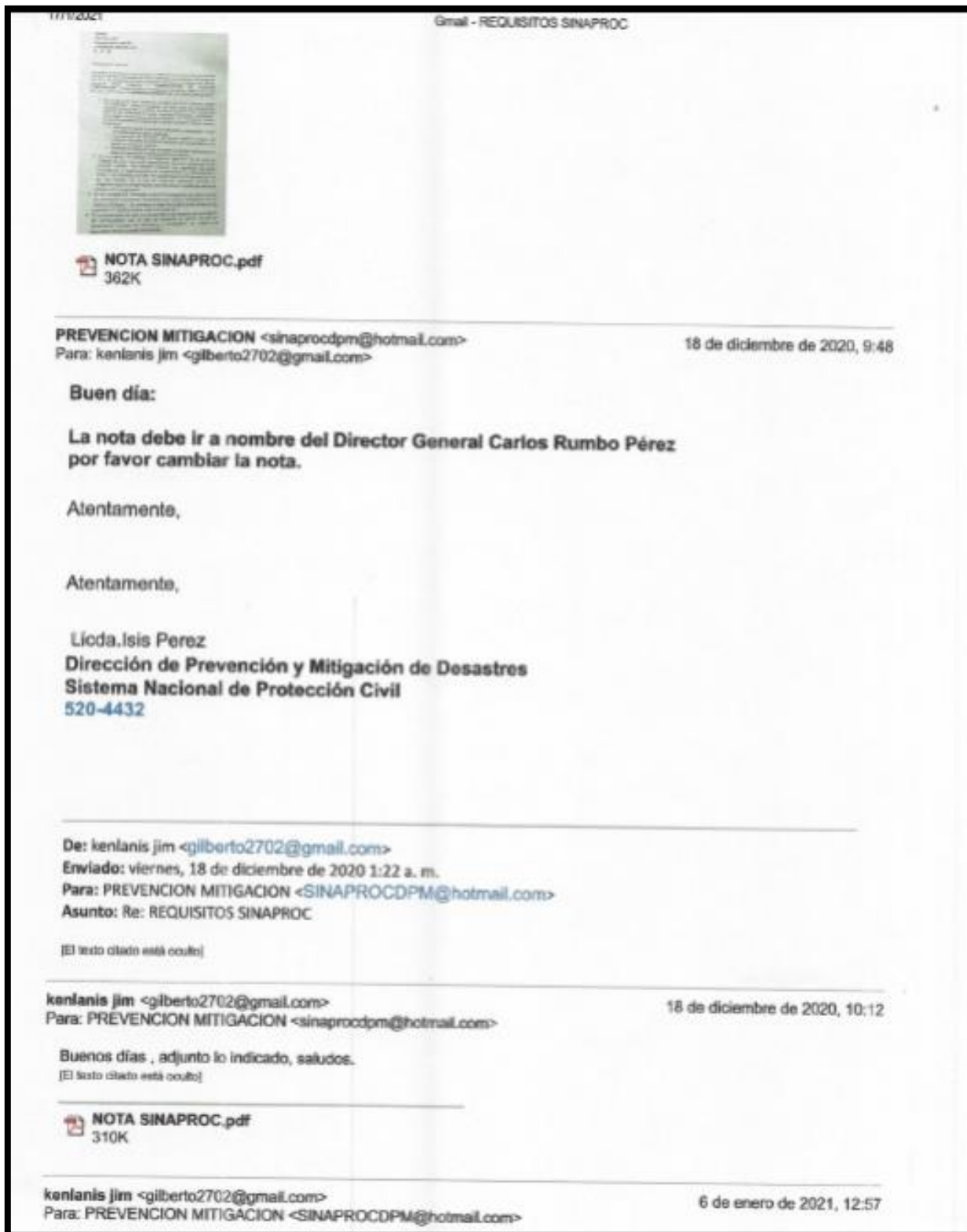
Imagen No.3: Correo de entrega de la solicitud corregida (18/12/20)