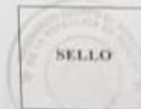
Imagen No.4: Certificado de construcción emitido por los Bomberos.