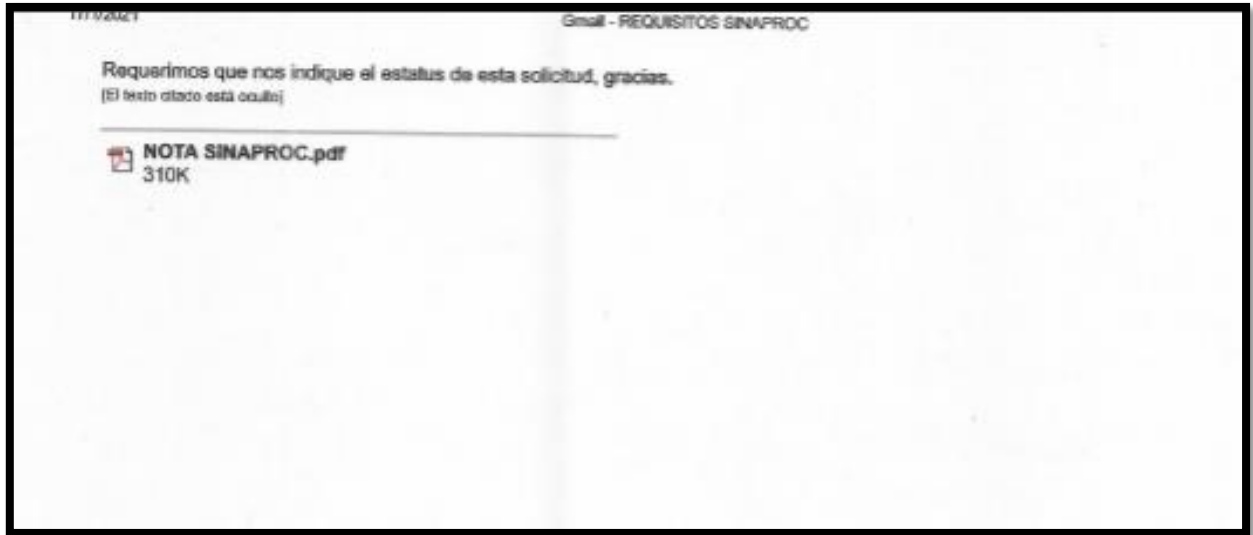
Imagen No.3: Solicitud de estatus del trámite (6/01/21), sin respuesta a la fecha.