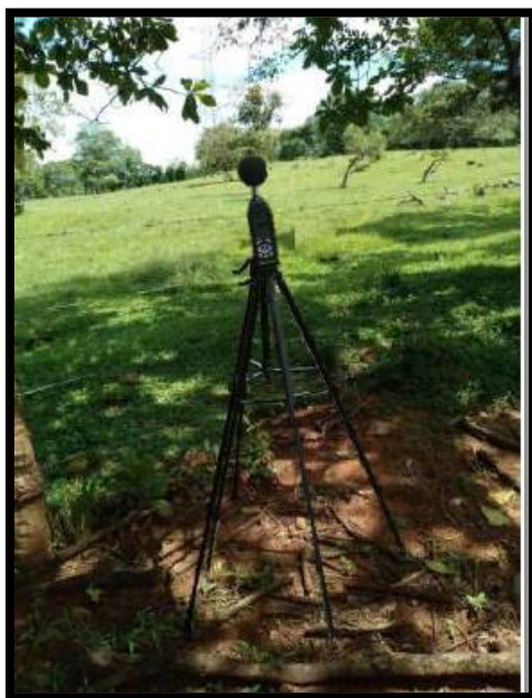
Área del proyecto 0345736E; 0937985N