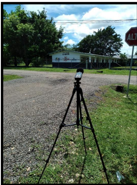
Escuela Quiteño 0346302E; 0937015N