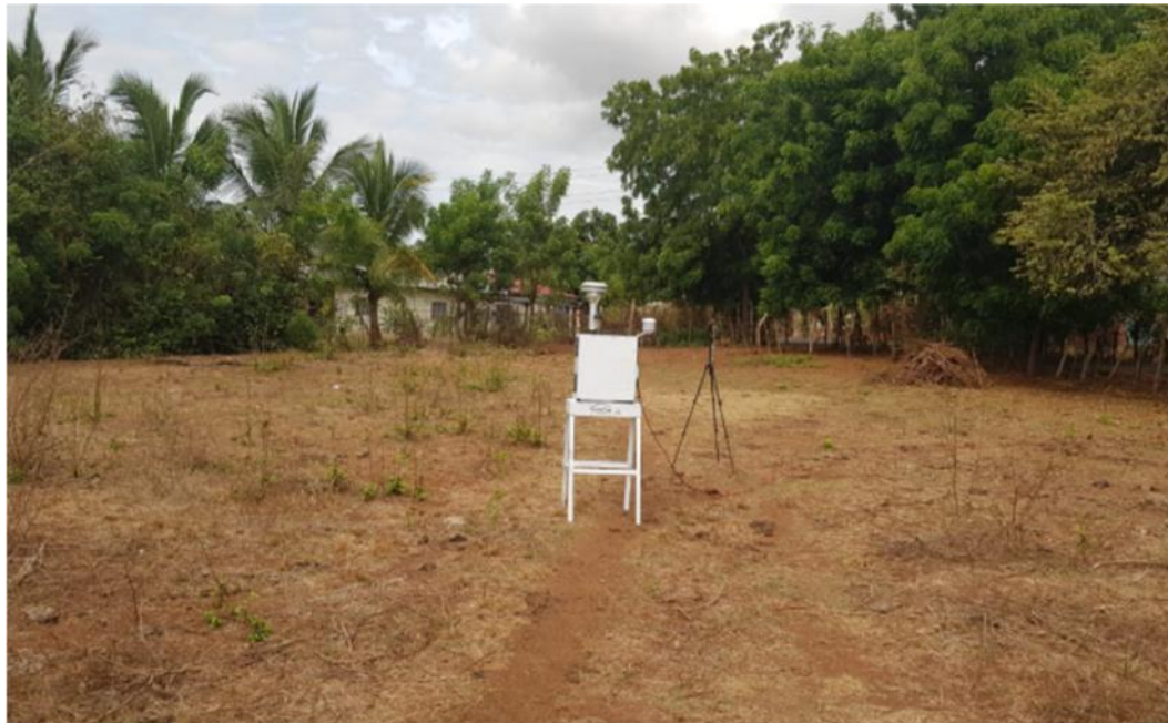
EM1 Terrenos del proyecto colindantes a Nutre Hogar