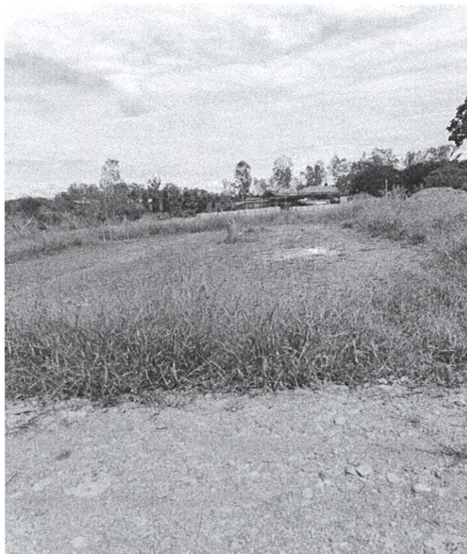
Fig. No. 2: Área en donde se llevará a cabo la construcción de la Galera.