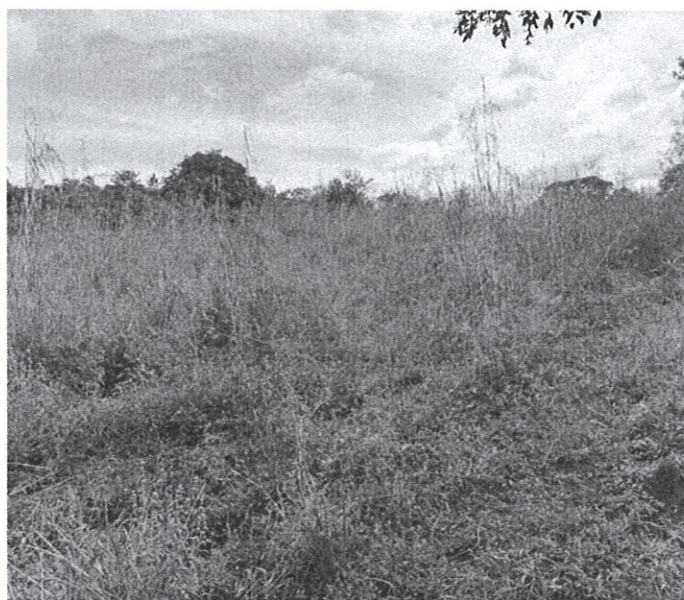
Fig. No. 3: Área en donde se encontrará ubicados los estacionamientos.