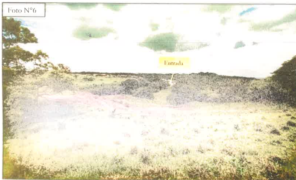
FOTO N°6: Vista general desde una de las colinas ubicadas dentro de la finca a desarrollar. Se observa al fondo de la imagen la entrada a la finca.