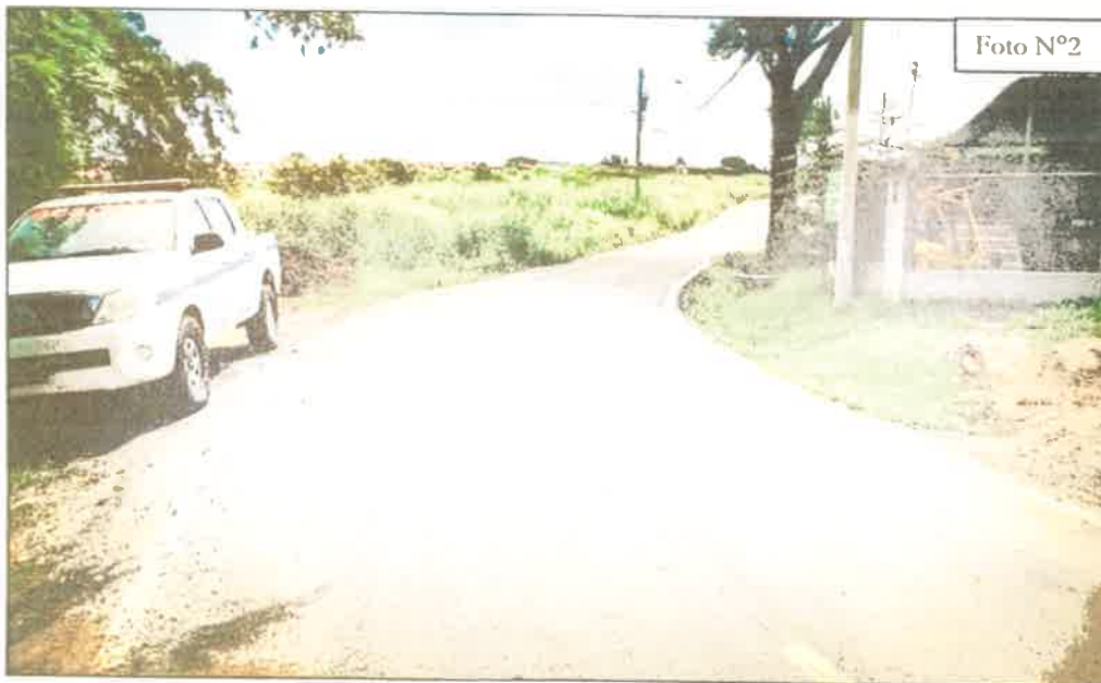
FOTO N°2: Se observa la vía Melida Rodríguez que da acceso a la finca a desarrollar.