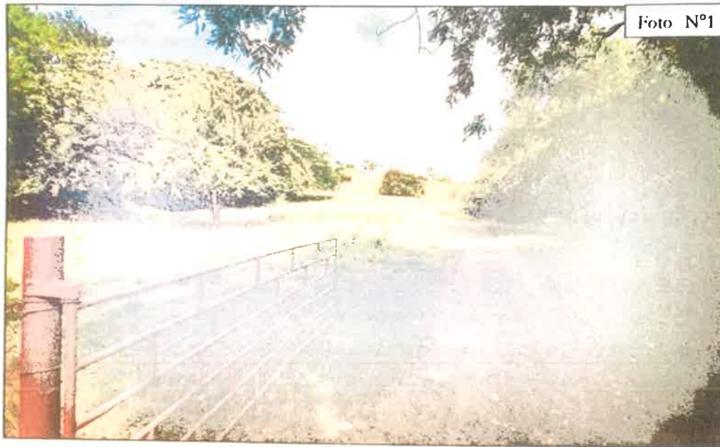
FOTO N°1: Vista general de la zona de la entrada a la finca a desarrollar.