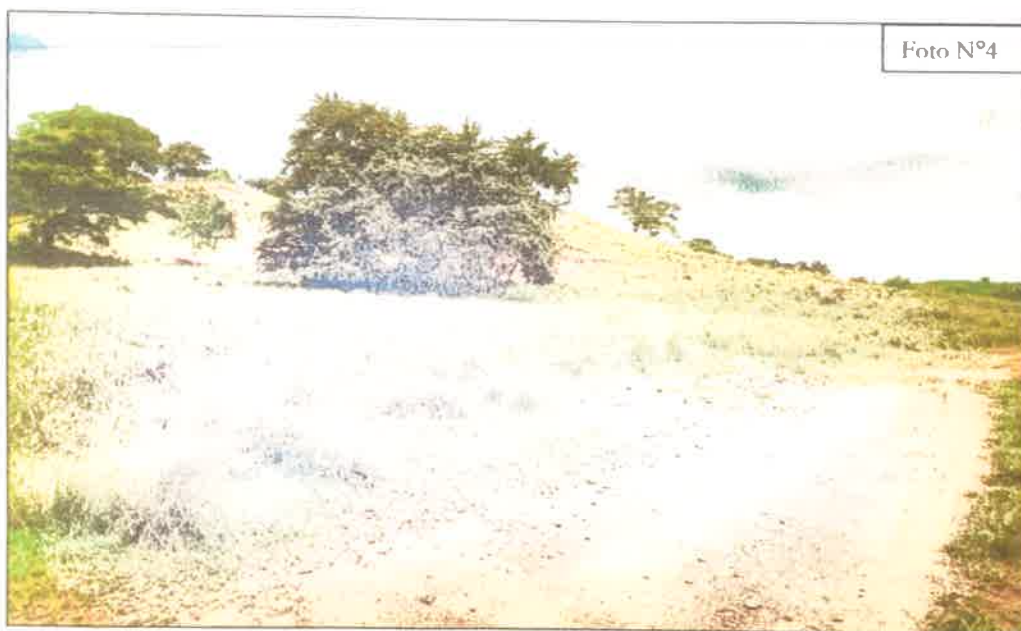
FOTO N°4: Se observa parte de la topografía y la vegetación de la finca a desarrollar.