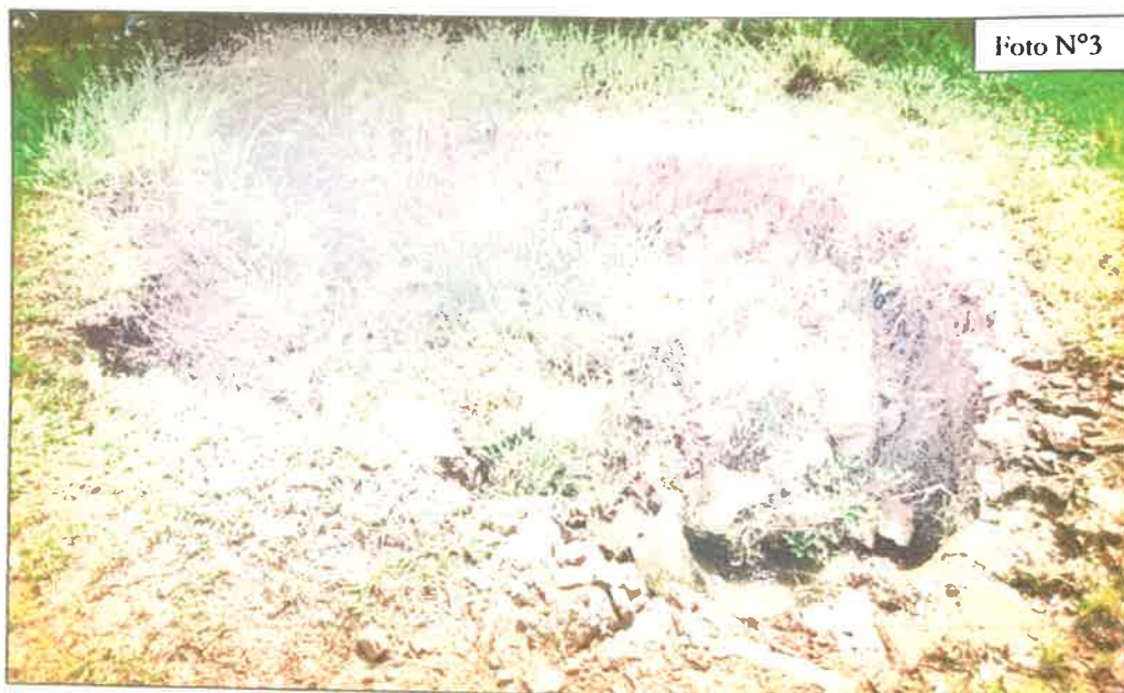
FOTO N°3: Se observa la presencia de agua cerca de la entrada a la finca a desarrollar.