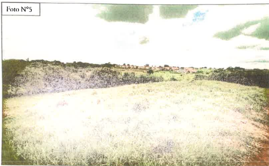
FOTO N°5: Se observa parte de la finca a desarrollar. Se observan algunas viviendas del residencial Brisas del Golfo.