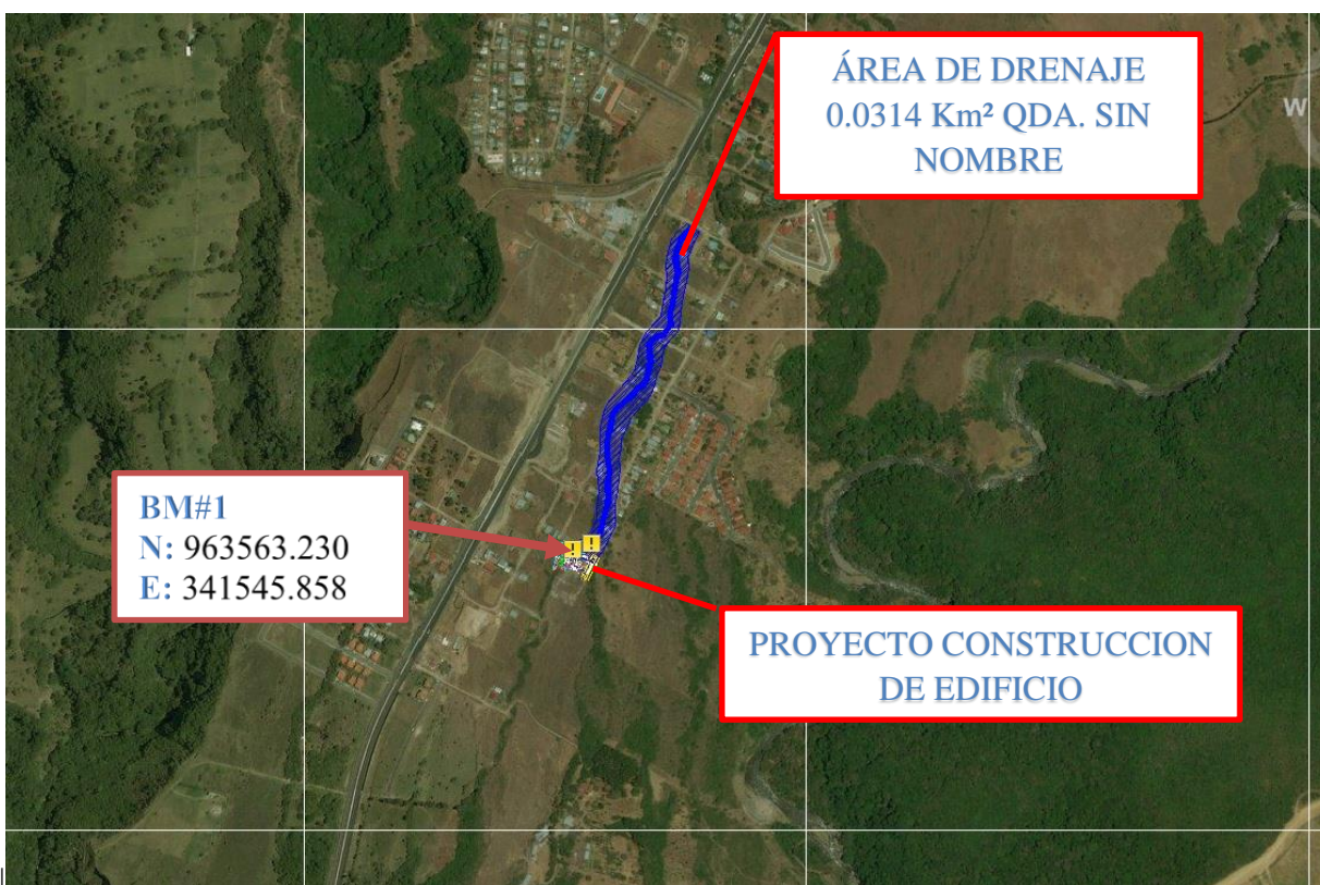
2FIG.1. Ubicación del Proyecto, Área de Drenaje. Escala: 1:25,000

El área de drenaje objeto de este estudio, comprende el área que afecta directamente al proyecto en estudio y el cual podemos apreciar en la Fig. 2