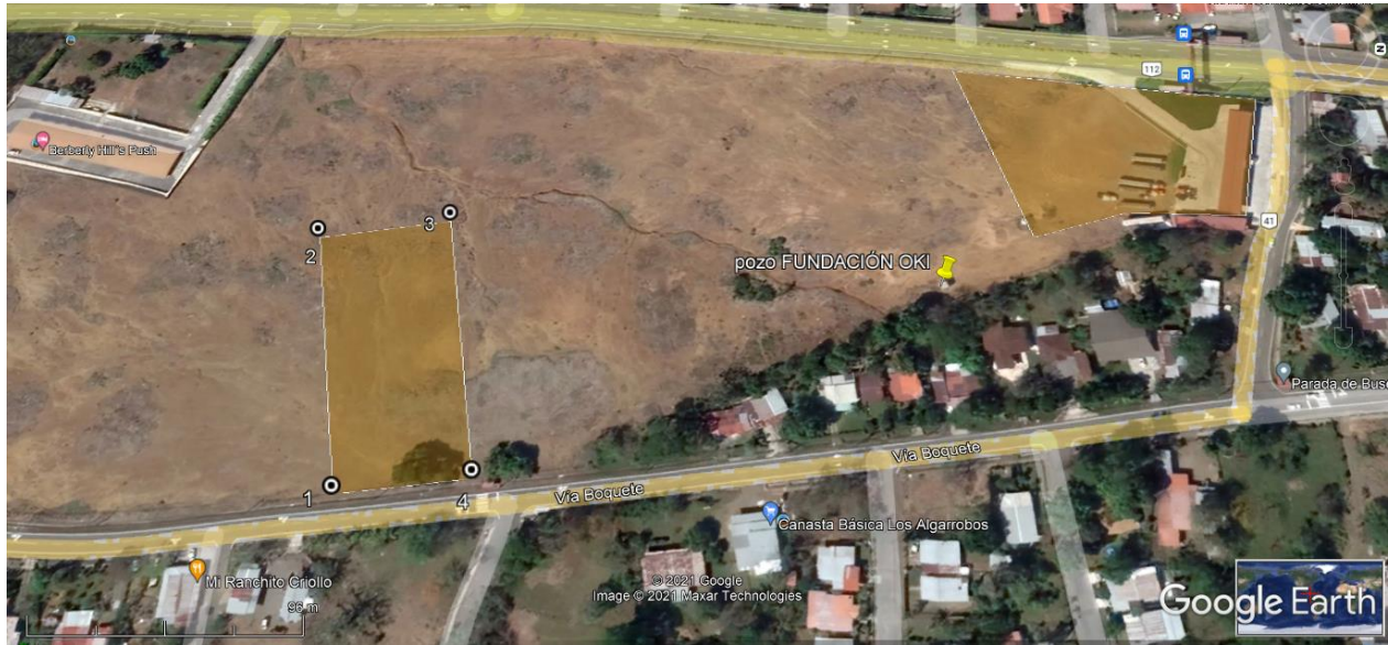
Ubicación georreferenciada del pozo propiedad de FUNDACIÓN OKI

4. Con relación al punto 6.2. TOPOGRAFIA, se le solicita lo siguiente: