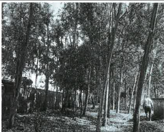
Fig. 19. Vista de la vegetación entronque Costa del Este.