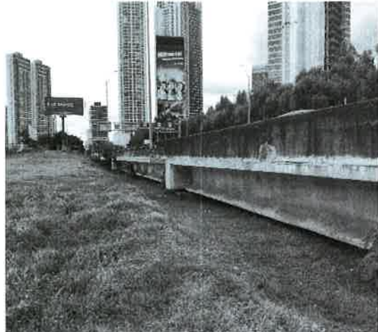
Fig. 26. Vista del ambiente socioeconómico entronque Costa del Este.