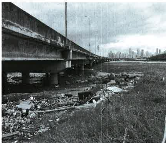
Fig. 15. Vista del Océano Pacífico.