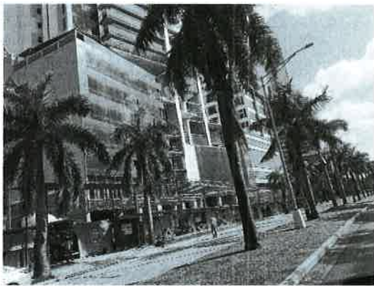
Fig. 7. Vista del límite Este del área entronque Costa del Este.