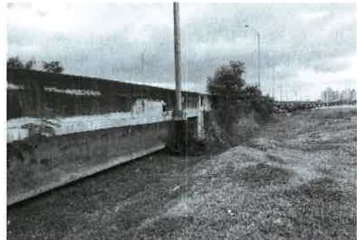
Fig. 2. Vista de la topografía área de entronque Costa del Este