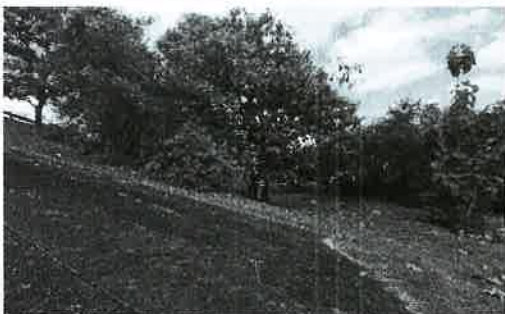
Fig. 3. Vista de topografía entronque Hipódromo.

Presenta topografía irregular, ligeras depresiones y elevaciones.