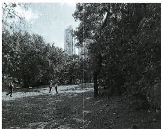
Fig. 22. Vista de la vegetación entronque Hipódromo.