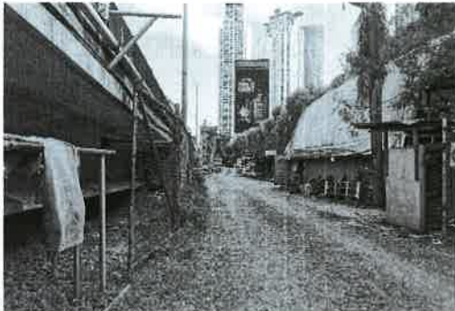
Fig. 1. Vista de la topografía área de entronque Costa del Este.

Presenta una topografía bastante plana, en los laterales derecho e izquierdo del Corredor Sur.