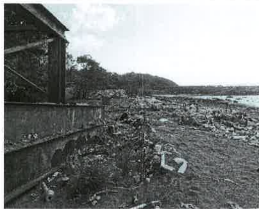
Fig. 6. Vista del límite Sur del área entronque Costa del Este.