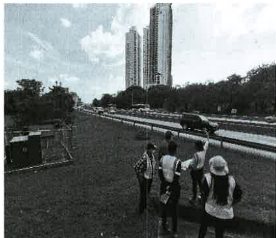
Fig. 28. Vista del ambiente socioeconómico entronque Costa del Este.