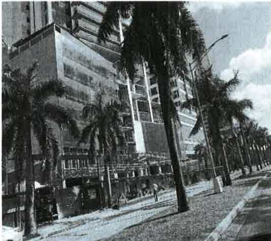
Fig. 25. Vista del ambiente socioeconómico entronque Costa del Este.

El polígono de desarrollo del proyecto se encuentra inmerso en una zona donde se encuentran residencias, edificios de apartamentos, locales comerciales.