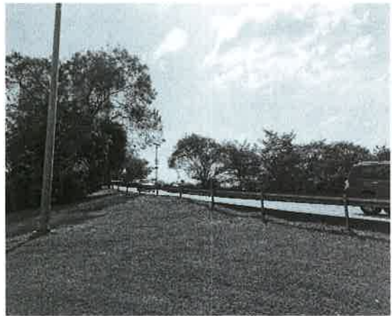
Fig. 12. Vista del límite Oeste del área entronque Hipódromo.