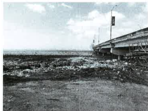
Fig. 8. Vista del límite Oeste del área entronque Costa del Este.