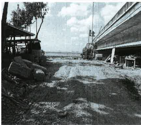
Fig. 13. Vista del Océano Pacífico.

Al momento de la inspección se observó una gran cantidad de desechos sólidos sobre la playa.