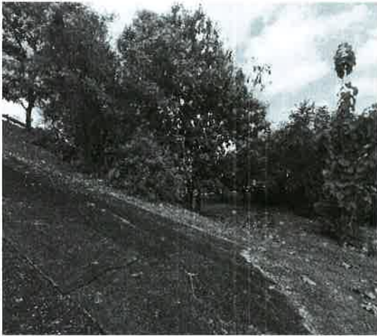
Fig. 23. Vista de la vegetación entronque Hipódromo.