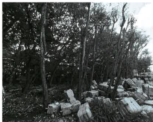
Fig. 18. Vista de la vegetación entronque Costa del Este.