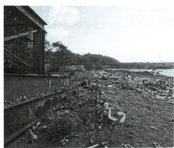
Fig. 16. Vista del Océano Pacífico.