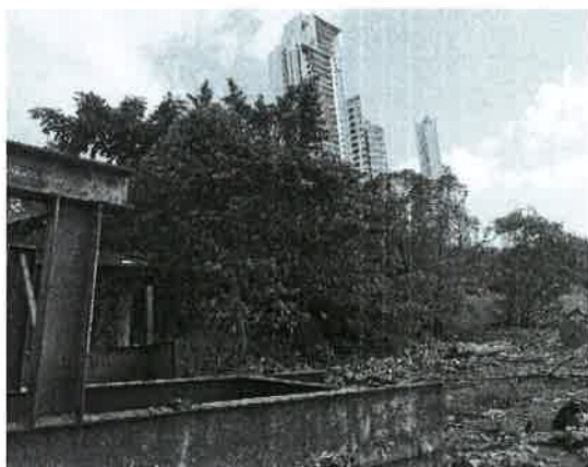
Fig. 17. Vista de la vegetación entronque Costa del Este.

La vegetación de la zona Sur-Este está conformada por pequeñas formaciones de mangle y en la zona más próxima a la avenida Paseo del Mar Costa del Este por árboles de eucalipto. En el área Norte por especies gramíneas.