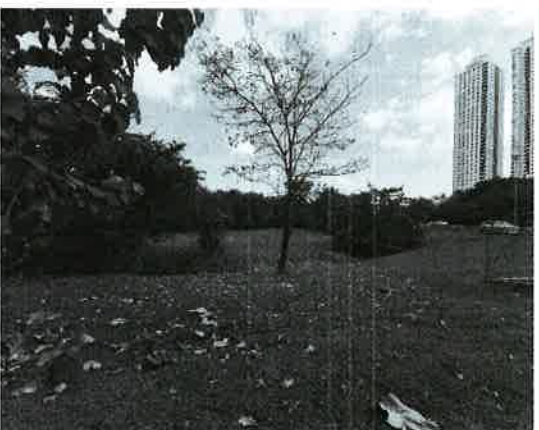
Fig. 21. Vista de la vegetación entronque Hipódromo.

La vegetación de esta zona se encuentra conformada principalmente por especies gramíneas, y pequeños arbustos de especies tales como: teca, guácimo, entre otros.