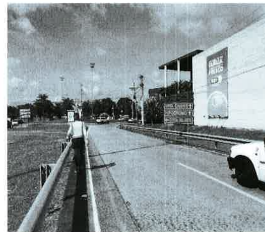
Fig. 27. Vista del ambiente socioeconómico entronque Costa del Este.