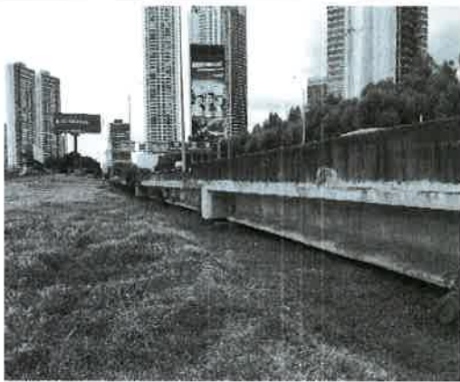
Fig. 5. Vista del límite Norte del área entronque Costa del Este.