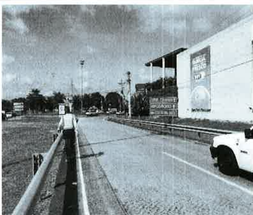
Fig. 9. Vista del límite Norte del área entronque Hipódromo.