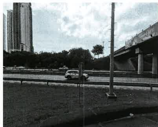
Fig. 10. Vista del límite Sur del área entronque Hipódromo.