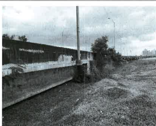
Fig. 20. Vista de la vegetación entronque Costa del Este.