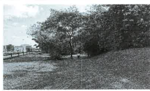
Fig. 4. Vista de topografía entronque Hipódromo.