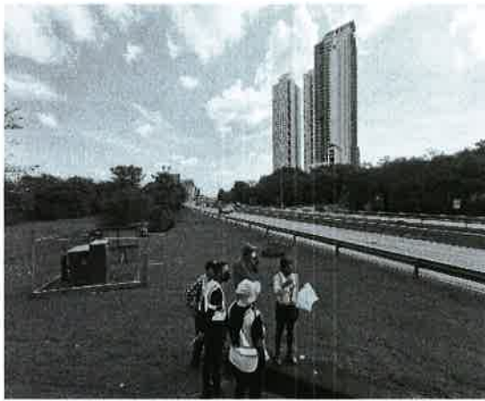
Fig. 11. Vista del límite Este del área entronque Hipódromo.