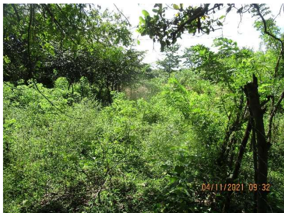
Fotos 1, 2, 3, 4 Sectores prospectados en la totalidad del polígono del proyecto. Terreno tipo potrero con herbazales, malezas, y gramíneas. Se observaron trazas de actividades humanas.