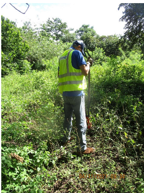
Fotos 5, 6, 7, 8, 9 Aplicación de pruebas de campo; sondeos en polígono