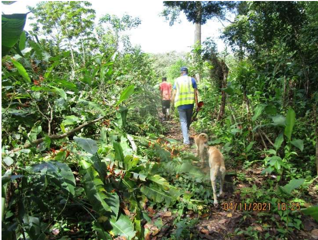
Fotos 16, 17, 18, 19, 20 Exploración en terreno, y pruebas de campo.