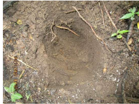
Fotos 10, 11, 12, 13, 14, 15 Aplicación de pruebas de campo; sondeos en polígono