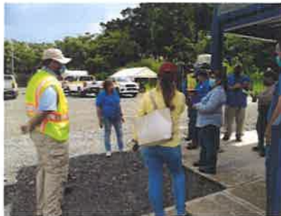
PREGUNTA Y RESPUESTA SOBRE EL EIA CATEGORIA II DE MANEJO DESECHOS PELIGROSOS