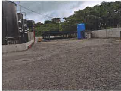
AREA YA CONSTRUIDA