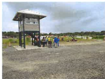
REUNION DE EXPLICACION DEL EIA CATEGORIA II