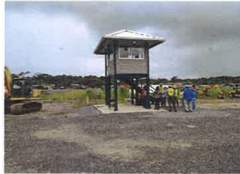
AREA DONDE SE VA A CONSTRUIR EL INCINERADOR