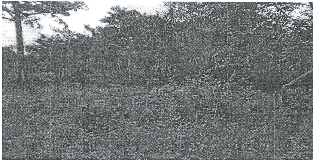
Foto 1: Vista panorámica del terreno de la finca No. 30279026 donde se desarrollará el proyecto Residencial EMMA'S VILLAGE, donde su topografía es bastante regular, con mucha vegetación.