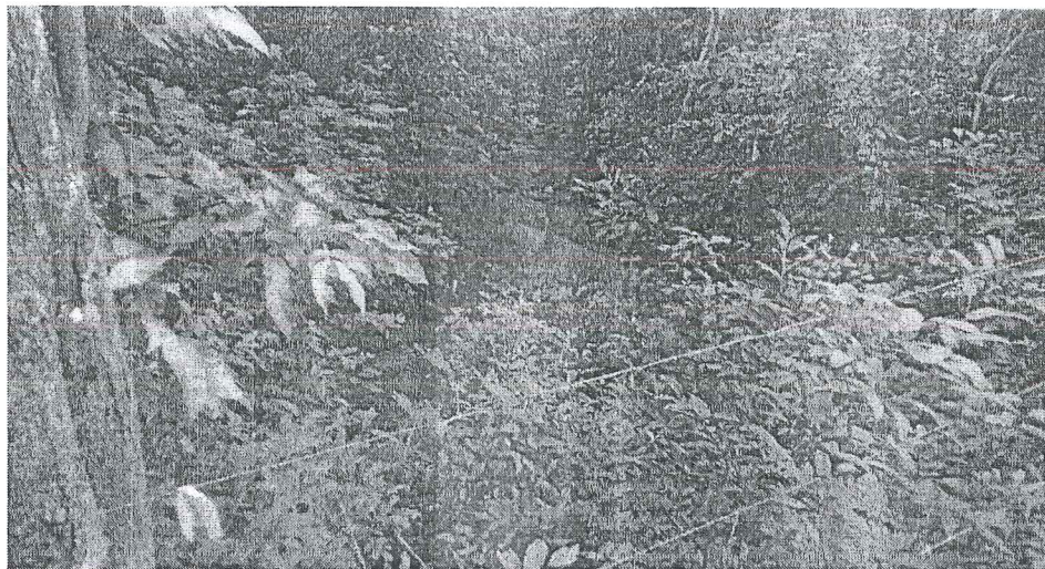
Foto 4: parte posterior de la finca donde se observa la quebrada sin nombre y la misma Mantiene seca.