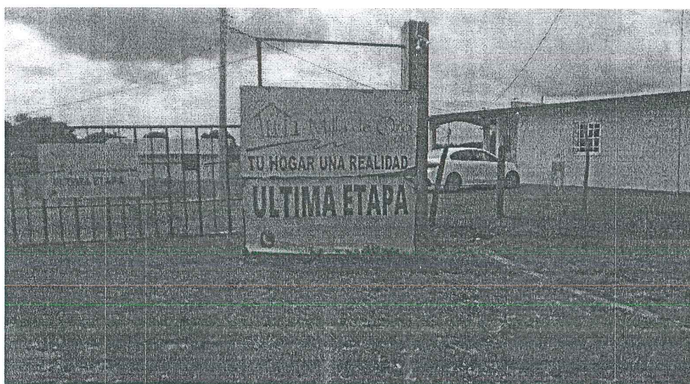
Foto 3: vista de la urbanización la MILLA DE ORO, que colinda con el proyecto en construcción EMMA'S VILLAGE.