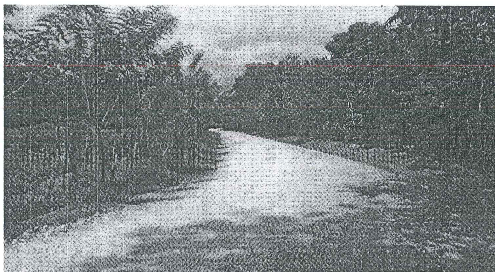
Foto 2: calle principal que comunican con el proyecto en construcción EMMA'S VILLAGE y la Urbanización MILLA DE ORO.