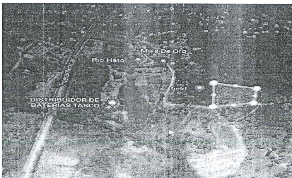
Foto 5: Imagen De La Localización Del Proyecto Residencial en construcción EMMA'S VILLAGE