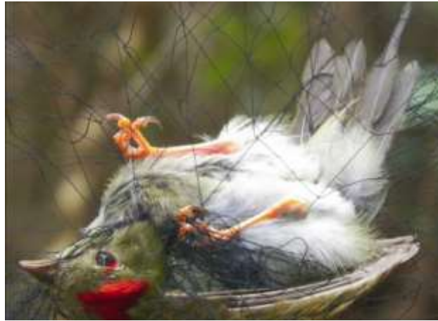
Fig. 1. Captura de aves a través del uso de redes de niebla.