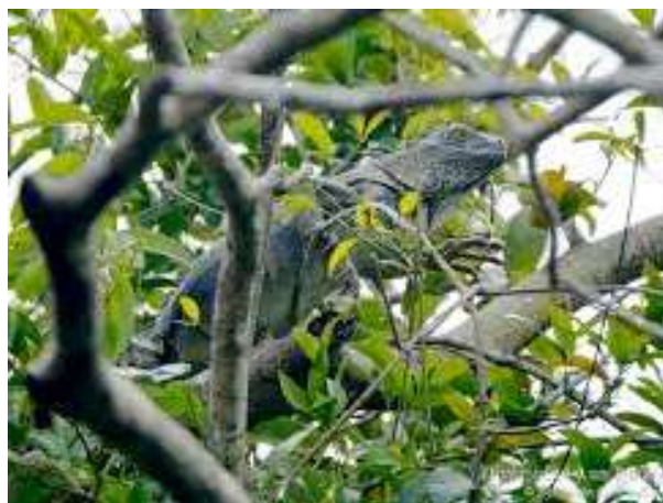
Fig. 8. Iguana Verde ( Iguana iguana ), observado en el área de estudio