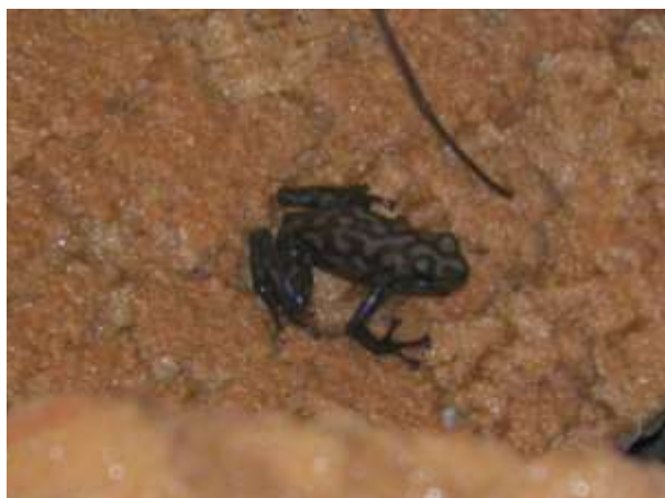
Fig. 4. Variedad de rana verdinegra ( Dendrobates auratus ), observada en el área de estudio