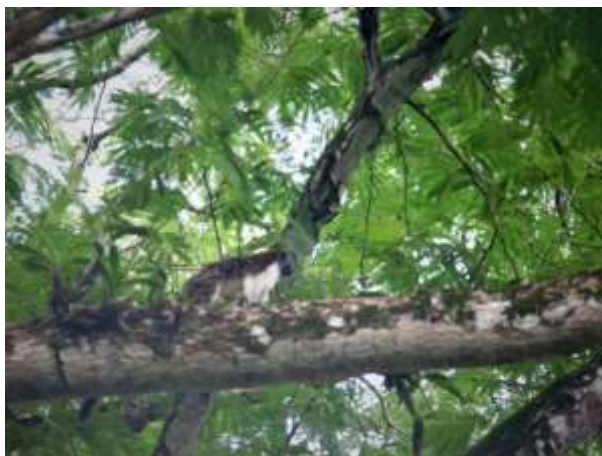
Fig. 7. Observación de mono titi ( Saguinus geoffroyi ) en el área de estudio.