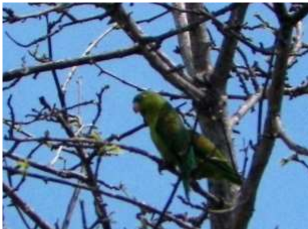
Fig. 3. Perico Brotogeris jugularis observado en el área de estudio.