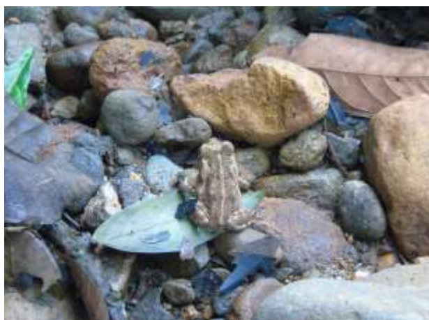
Fig. 5. Sapo común ( Rhinella marina ), observado en el área de estudio