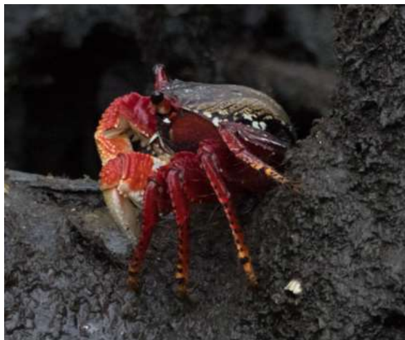
Fig. 9. Cangrejo rojo ( Goniopsis cruentata ), observado en el área de estudio