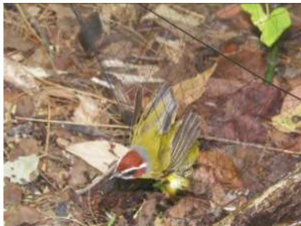
Fig. 2. Captura de la reinita colonirufa ( Basileuterus rufifrons ) en redes de niebla.