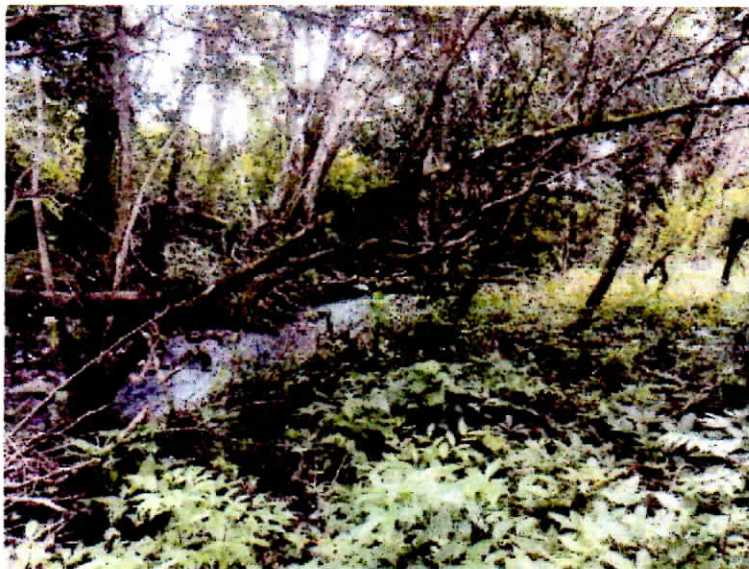
Cauce del río Papayalito.