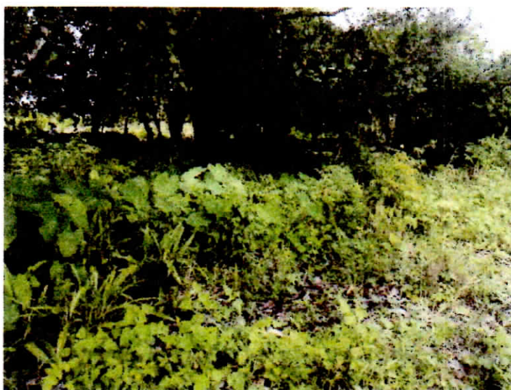
Vegetación próximo a los cauces de quebrada y río.