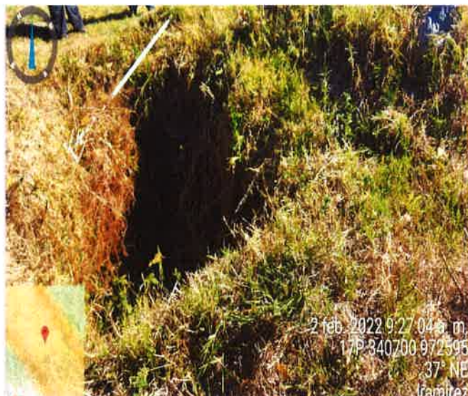
Foto 3. Imagen del área donde se ubicará el tanque séptico.