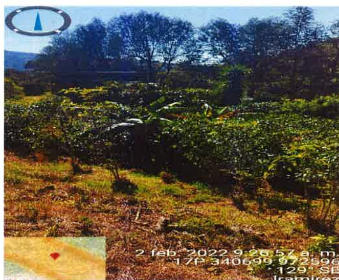
Foto 4. vista de la parte de atrás del área a impactar.