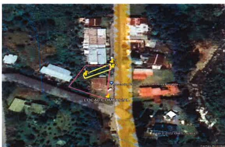
Imagen 1.: Mapa del recorrido realizado en la inspección de campo -El polígono de color amarillo área a impactar indicado por el Consultor ambiental y el promotor durante la inspección -El polígono de color rosado es el polígono formado por las coordenadas presentadas en el EsIA.