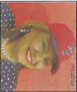
PATYPRESTAMOS: jubilados de contratoría haga su préstamo sin exámenes médicos, no venos apc, programe su presupuesto, 394-8811, cel 6765-4290