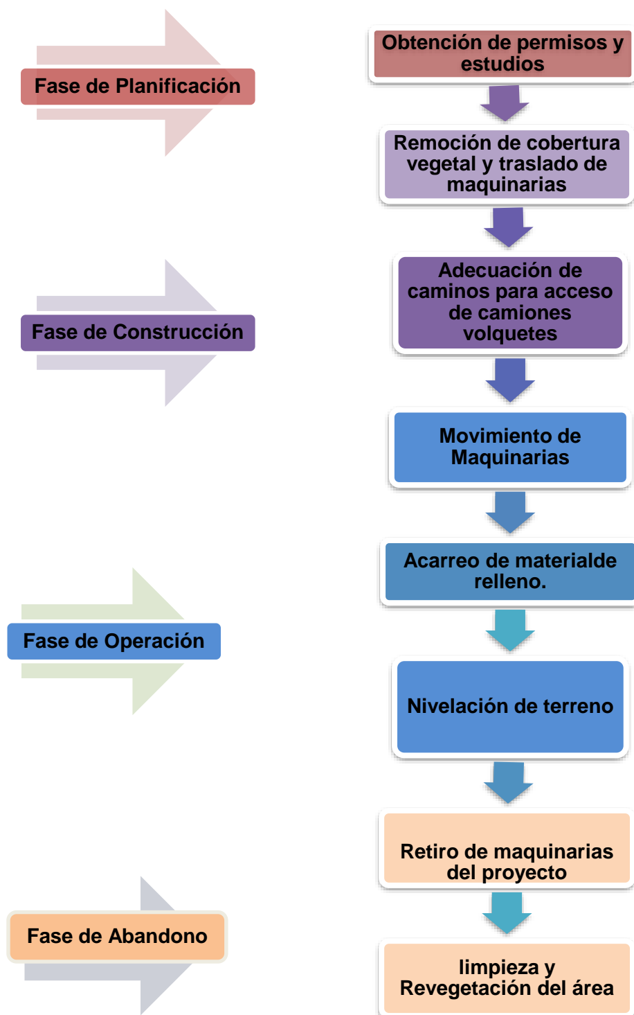
Figura N°5.3. Descripción de la Fase de Construcción, Operación y Abandono del Proyecto "SITIO DE PRESTAMO RESIDENCIAL COLINAS DEL SUR".