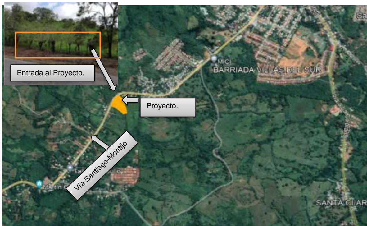
Figura 5.1. Área del proyecto "SITIO DE PRESTAMO RESIDENCIAL COLINAS DEL SUR".

A continuación, se observa la ubicación del proyecto, ubicado en el corregimiento de Edwin Fábrega, distrito de Santiago, Provincia de Veraguas, sin embargo, en el Registro Público la finca está ubicada en el corregimiento de Santiago, por lo cual se adjunta certificación de la juez de paz del corregimiento. Ver anexo N 8.