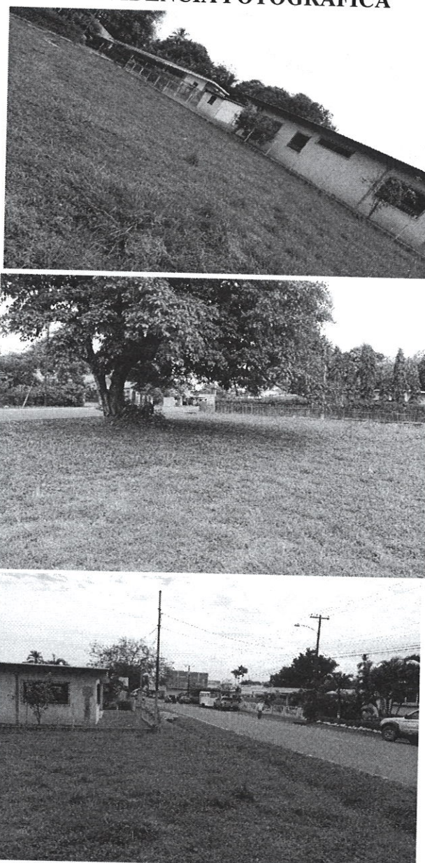
Fig. 1, 2, 3. Área propuesta para el desarrollo del proyecto