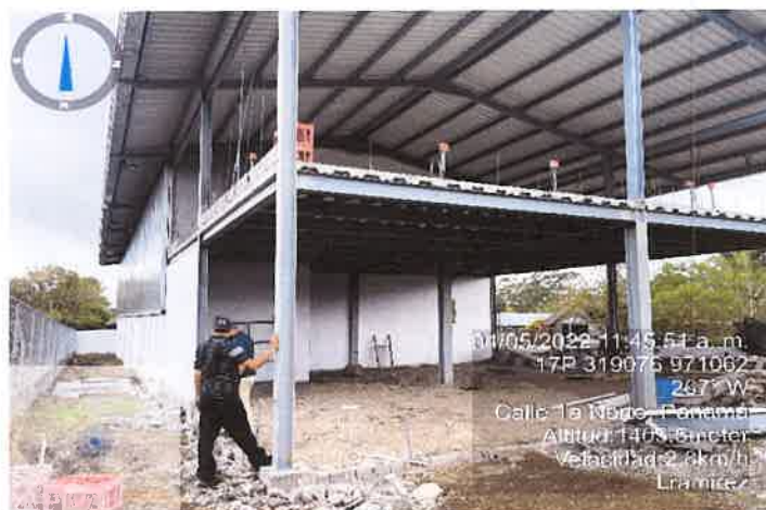
Foto 3. vista del área del proyecto Cat. I, LOCAL COMERCIAL.