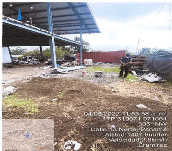
Foto 1 y 2. Vista del avance de construcción del proyecto CAT. I, LOCAL COMERCIAL.