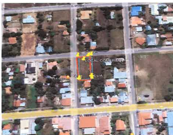
Imagen 1.: Mapa del recorrido realizado en la inspección de campo -El polígono de color turquesa es el polígono de las coordenadas tomadas durante la inspección -El polígono de color rojo es el polígono formado por las coordenadas presentadas en el EsIA.