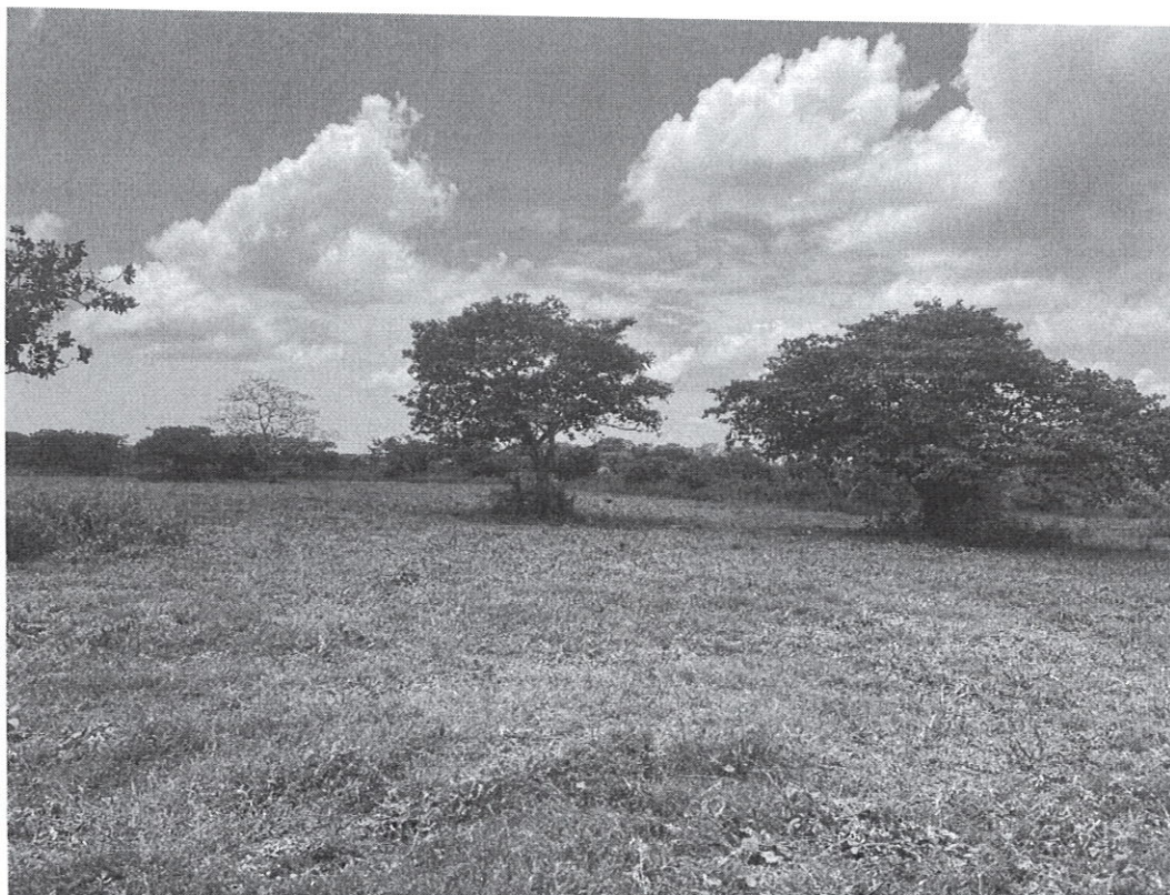
Fig. 2. Área del Proyecto y vegetación existente en el área