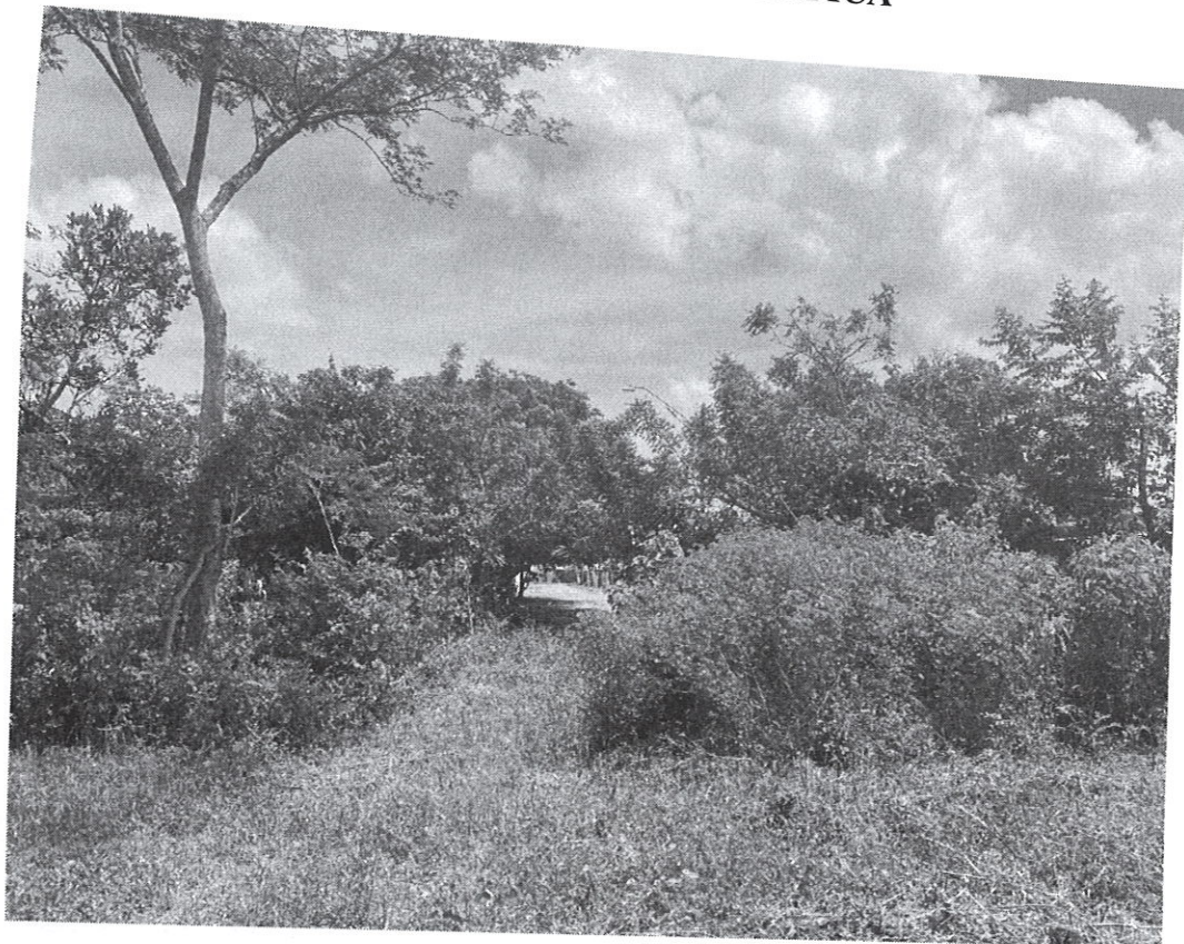
Fig. 1: Entrada al proyecto