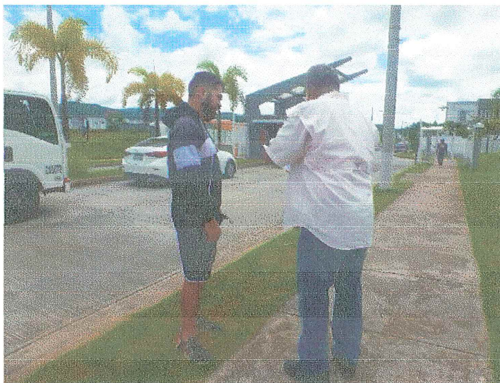
ENTREGA DE VOLANTE INFORMATIVA APLICACIÓN DE ENCUESTA