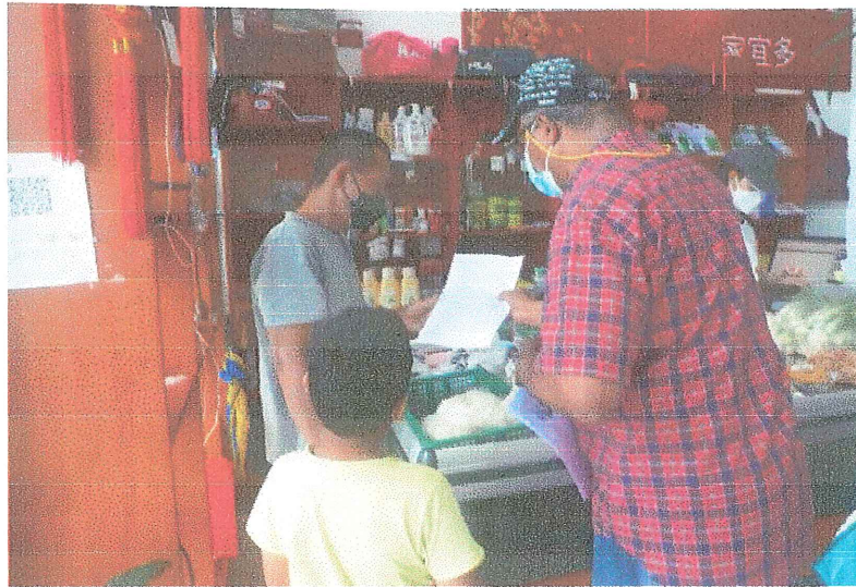
ENTREGA DE VOLANTE INFORMATIVA APLICACIÓN DE ENCUESTA