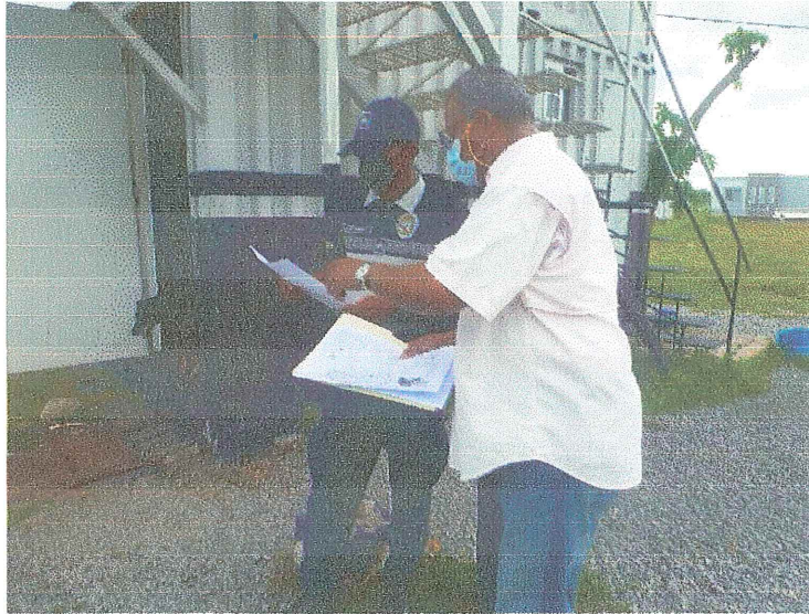
ENTREGA DE VOLANTE INFORMATIVA PRESENTACIÓN DEL PROYECTO