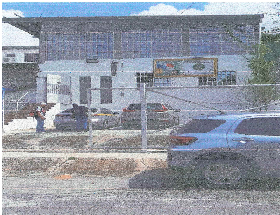
JUNTA COMUNAL ERNESTO CORDOBA ENTREGA DE LA VOLANTE INFORMATIVA