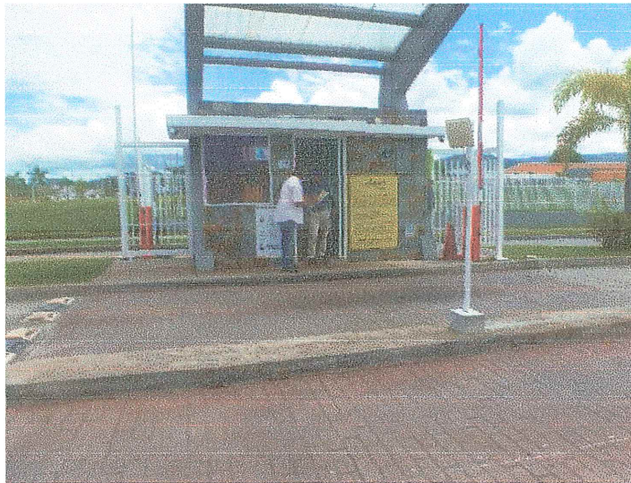
ENTREGA DE VOLANTE INFORMATIVA PH AUGUSTA