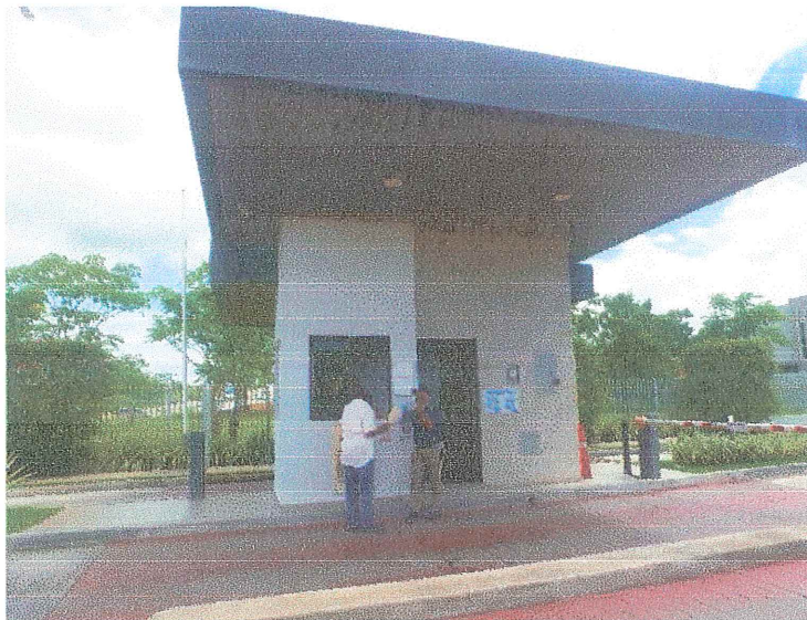
ENTREGA DE VOLANTE INFORMATIVA PH VICTORIA