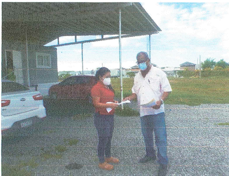
ENTREGA DE VOLANTE INFORMATIVA APLICACIÓN DE ENCUESTA