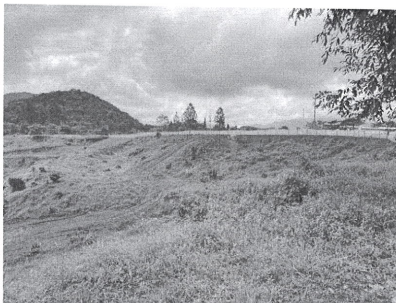
Fig. 3. Vista de la propiedad