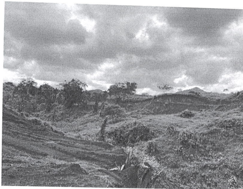
Fig. 2. Drenaje natural existente