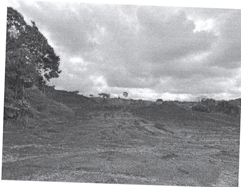
Fig. 1: Trabajos realizados en el área