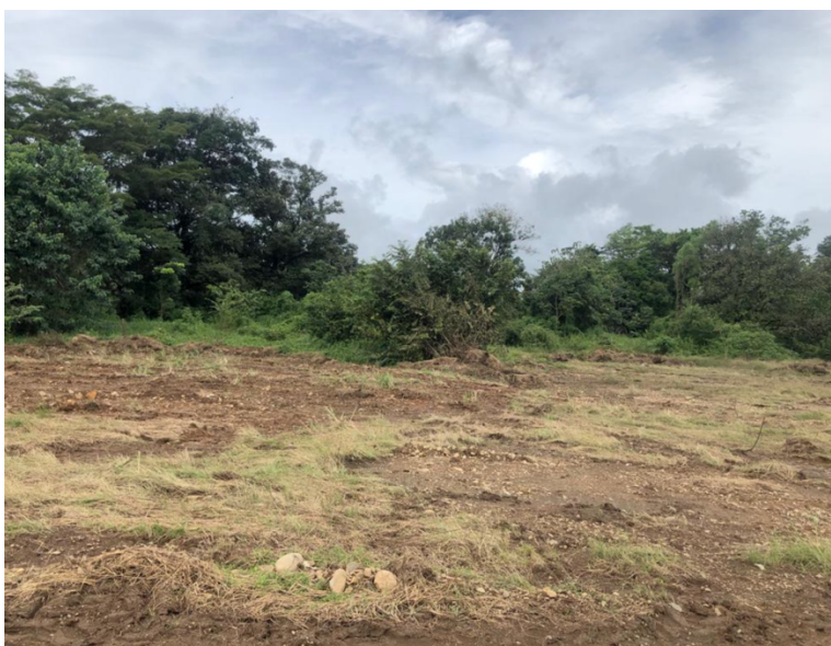
Ilustración 3. Vista de la cobertura vegetal típica del área

Debido a la ausencia de árboles con diámetros superiores a los 15 cm, en el área planificada para el área, se solicita la exoneración del inventario forestal, haciendo la salvedad, de que si el promotor, durante la operación, se ve en la necesidad de realizar tala de algún espécimen, deberá previamente coordinar con la Agencia del Ministerio de Ambiente del lugar, para obtener el debido permiso.