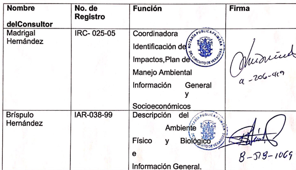
Cuadro No. 10. Profesionales, número de Registro, funciones y firma.

Los números de registro de los consultores se presentan en el punto anterior.