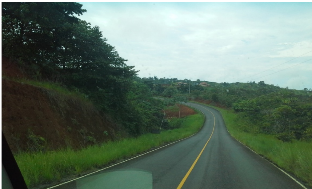
Ilustración 4. Calle que conduce al Distrito de Mariato.

Mariato es un lugar rural, en donde los servicios públicos son muy limitados y sus habitantes se concentran en los caseríos ubicados en la vía principal Mariato-Arenas. Sobre esta vía principal y en algunas calles aledañas, se extiende el tendido de distribución eléctrica que es solamente monofásico. El abastecimiento de agua potable es a través de acueductos rurales administrados por juntas locales y algunos residentes han invertido en pozos y turbinas privadas. El servicio de telefonía celular es la única que existe, y sólo en ciertas zonas a donde llega la señal del prestador; el servicio de cable y de internet es solo satelital, lo que lo hace muy costoso.