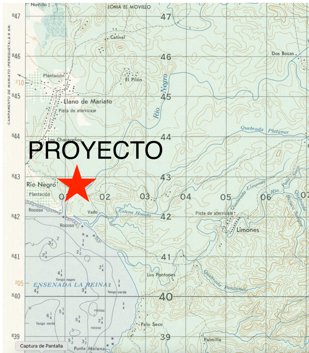
Ilustración No. 2. Extracto del mosaico topográfico 4038 IV (sin escala). La localización 1 en 50 mil solicitada, se encuentra en el Anexo 2 del presente documento.