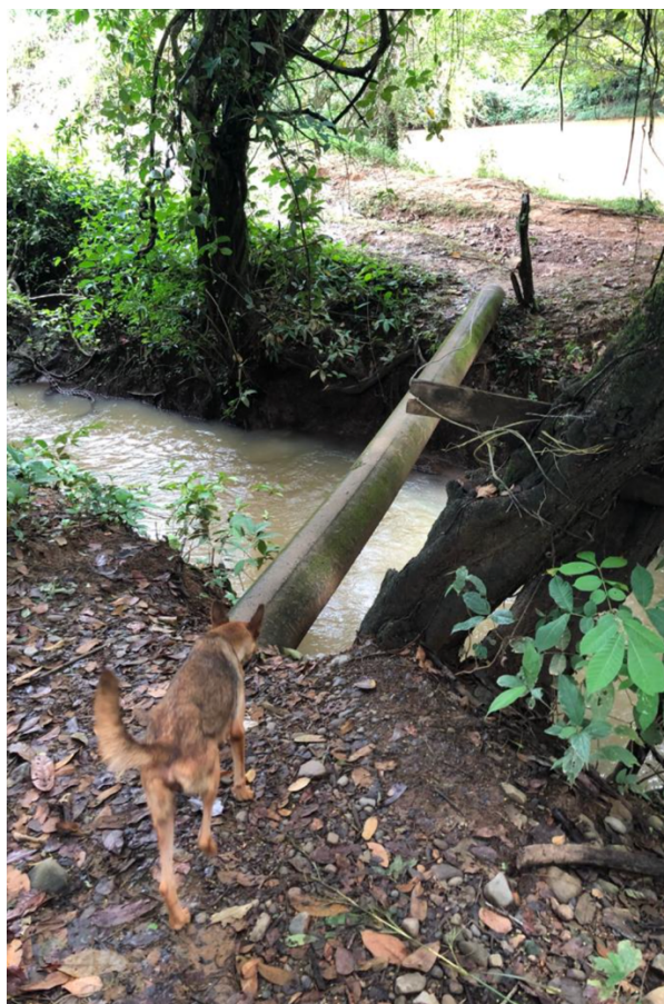
Ilustración 5. Uno de los cruces de quebrada utilizados por la población aledaña al proyecto.

En las tierras aledañas se desarrolla la ganadería extensiva, y en otras se observa la siembra de rubros como el arroz. También existen caseríos dispersos, sin embargo, la zona cuenta con cierta representación de entidades gubernamentales, tales como la Policía Nacional, El Ministerio de Ambiente y representantes de la Junta Comunal.