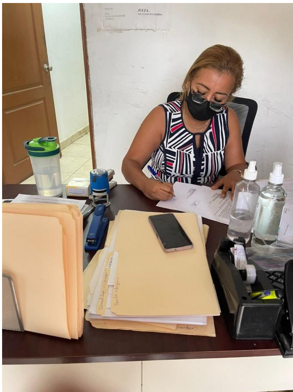
Juez de Paz del Corregimiento de Caimitillo