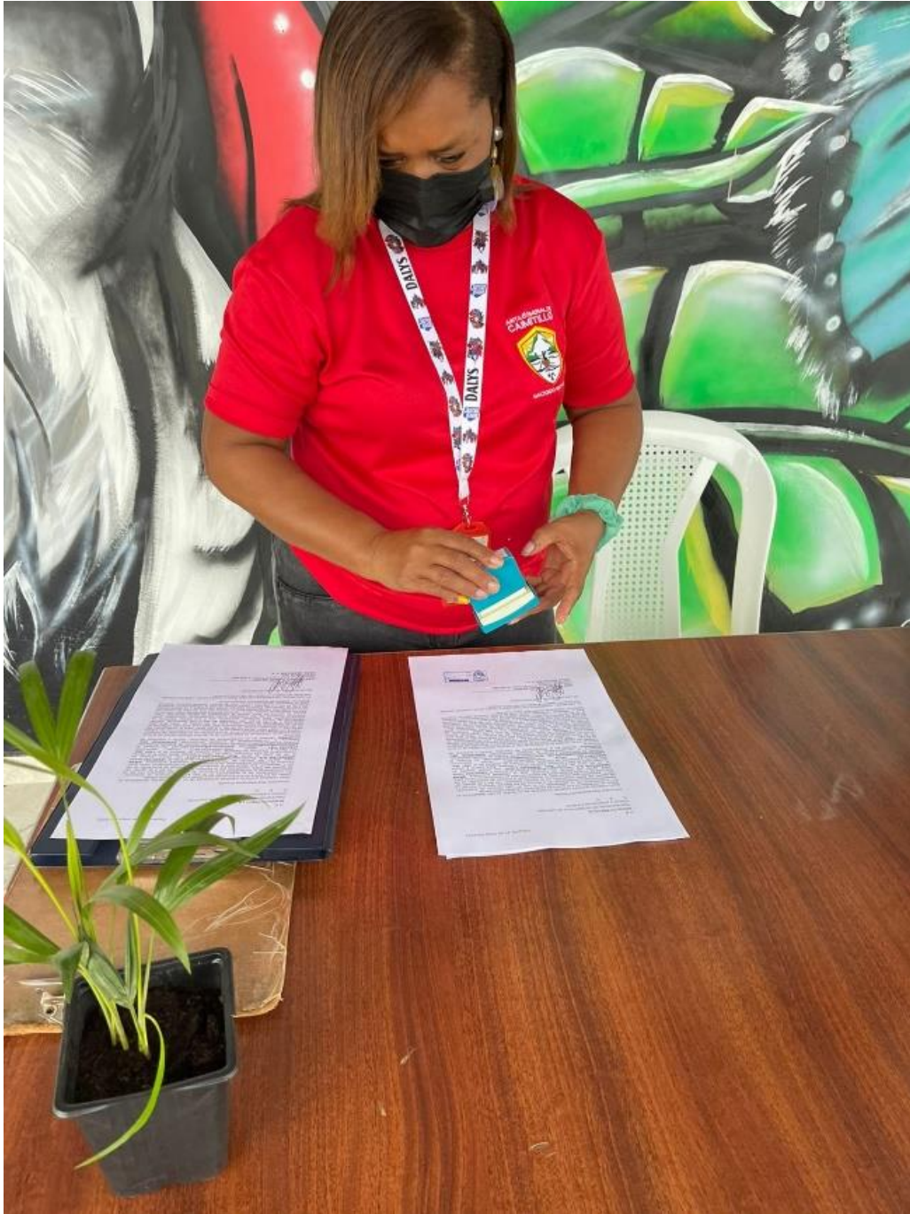
Representante de la Junta Comunal de Caimitillo