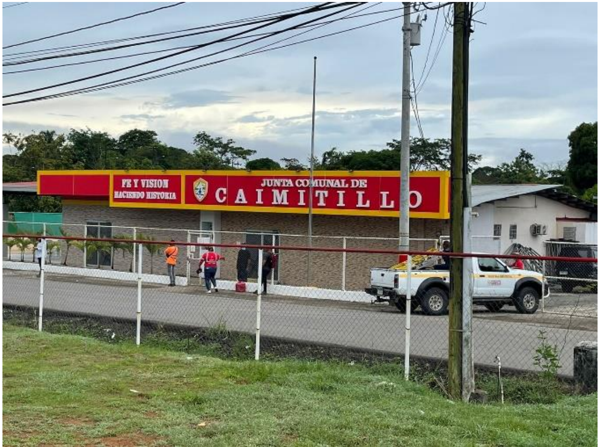
Junta Comunal de Caimitillo