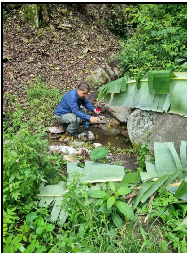
89-22. Quebrada Sin Nombre.