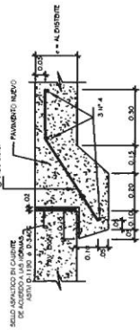
DETALLE DE EMPALME DE LOSA CON ESTACIONAMIENTO